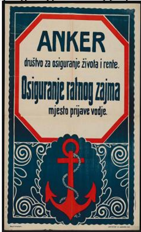
Пропагандни плакат за осигурање уписаног зајма 47

Поред истицања родољубља и сигурне финансије добити, наглашавало се како је одрицање од новца најкраћи пут до победе у рату. Ради што већег уписа зајма хрватски бан Иван Шкрлец Ломнички је 5. јуна 1917. године посебном окружницом установио Дан ратног зајма, током ког су у свим већим местима биле организоване разноврсне јавне манифестације и догађаји како би се становништво подстакло на што масовнији упис зајма. 45 Како би се становништву доказало да је зајам сигурна инвестиција Осигуравајуће друштво Анкер је нудило могућност осигурања уложеног ратног зајма. 46