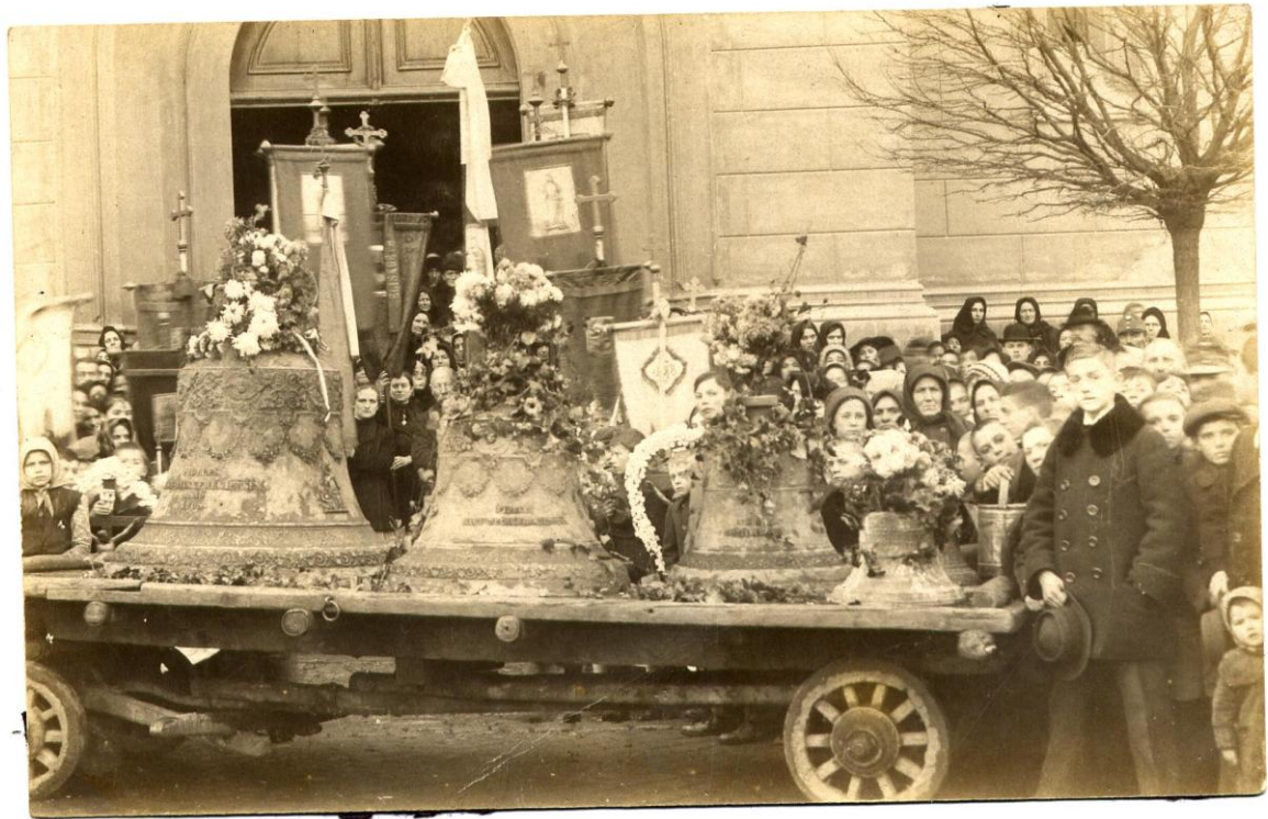
Реквизиција звона са Римокатоличке црква Светог Ивана Непомука у Великом Бечкереку 55

Како се ближио крај рата код становништва Војводине било је све мање расположења за упис ратног зајма. Све више је пружан отпор неодазивањем, нарочито код Срба, упркос притисцима и агресивној пропаганди аустроугарских власти. После акција реквизиције метала, кренуло се са апровизицијама хране. Према сведочанствима савременика тих дана у народу се веровало да се ближи крај рата. Почетком 1917. године Аустроугарска монархија је отворила нови унутрашњи фронт, на коме се борила против све већег броја дезертера и одметника од власти, познатих под именом „зелени кадар“. Стална несташница хране и других производа широке потрошње проузроковала је незапамћен раст цена, којим су нарочито били погођени најсиромашнији слојеви становништва. У таквој атмосфери уследио је пробој Солунског фронта септембра 1918. године, после ког је Аустроугарску монархију захватило опште расуло и распад.