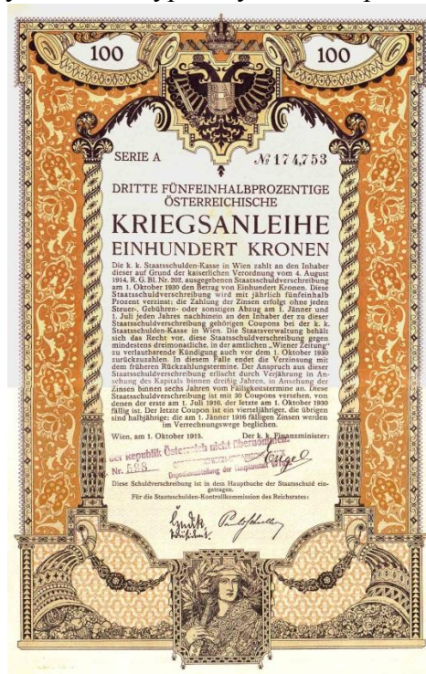
Обвезница трећег ратног зајма у вредности сто круна 48

Општа акција прикупљања метала за потребе аустроугарске војске започела је фебруара 1915. године наредбом председника угарске краљевске владе грофа Иштвана Тисе. Према тој наредби која је објављена широм Војводине сваки власник одређених метала био је дужан да властима пријави све залихе метала којима је располагао, а које су биле теже од 20 кг, као и да их преда до краја априла 1915. године. 50 Метал се