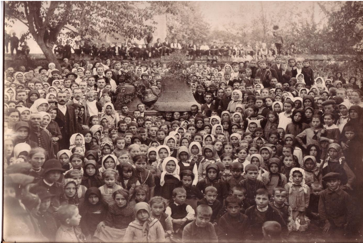
Реквизиција звона са Цркве Светог Јована Крститеља у Старој Паланци 54

Реквизиција црквених звона, као и бабра којим су били покривени црквени и манастирски торњеви, односно кровови одвијала се у неколико таласа током 1916 и 1917. године. Од реквизиције није била поштеђена ни једна верска конфесија у Војводини, а за однета звона црквене општине су биле обештећене са 4 круне по килограму. Добијеним новцем за однета звона цркве нису могле располагати, он је био уложен на рачуне финансијских институција, али под мораторијумом за трошење све до краја рата. 52 Под таквим околностима новац бележен на име одштете за реквирирана звона је делом или у целини уписиван за неке од ратних зајмова који су били расписани до 1918. године. 53