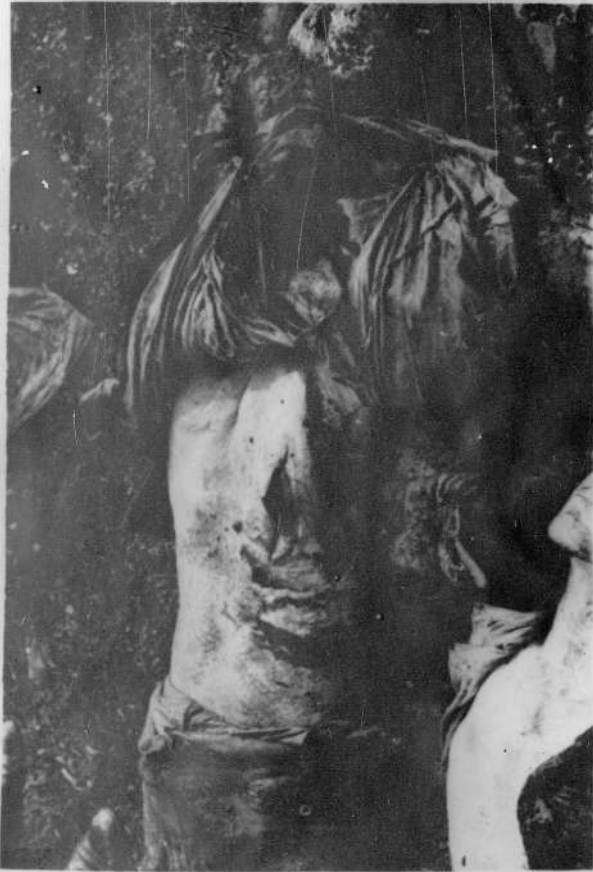
Der Rücken eines ermordeten serbischen Bauern