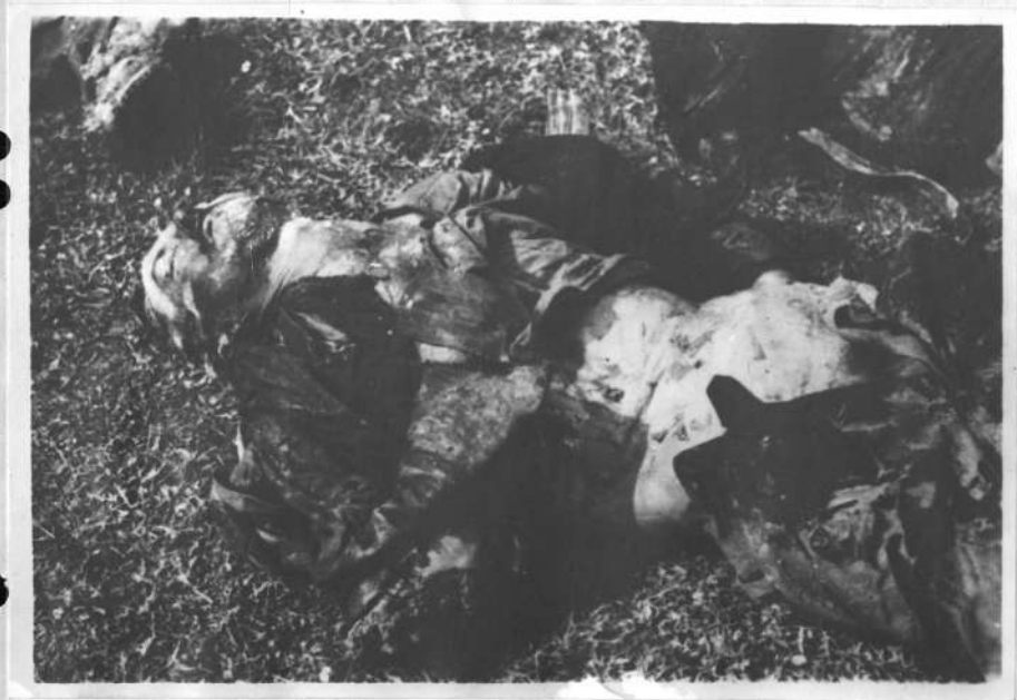
Messerstiche im Bauch eines Bauern .

Knife stabbings to the stomach of a peasant