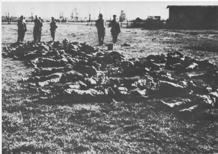
Покољ Срба у селу Гудовац, у округу Бјеловар

Abschlachtung der Serben im Dorfe G u d o v a c im Bezirke Bijelovar.