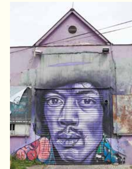
Мурал из Кинеске четврти