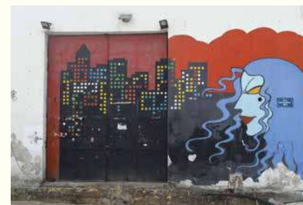
Мурал из Кинеске четврти