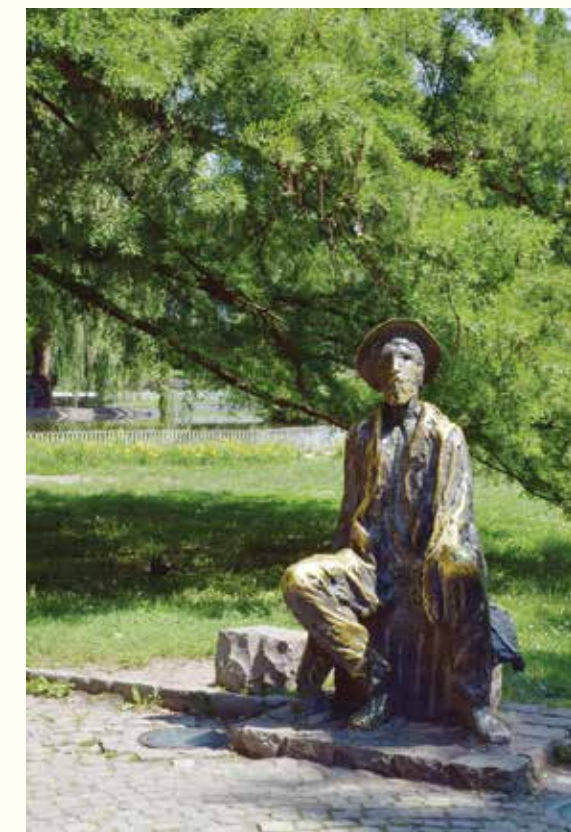
Споменик Ђури Јакшићу у Дунавском парку