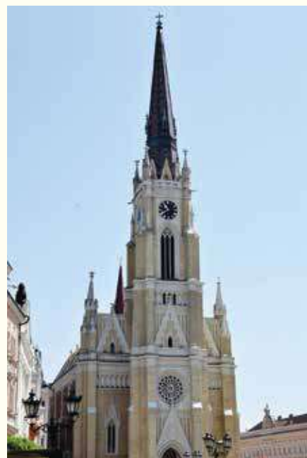
Римакајоличка црква Имена Маријиног