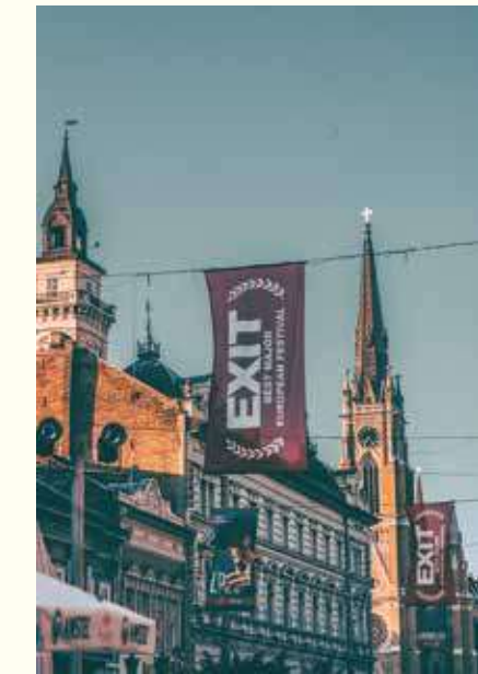
Поглед на цркву Имена Маријиног из улице Краља Александра