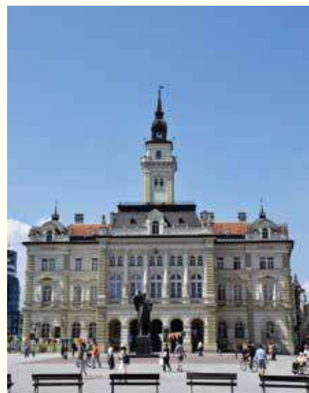
Градска кућа и споменик Свештозару Милосављевићу