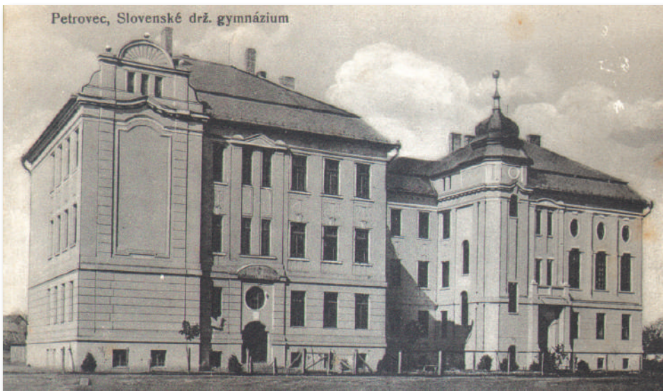
Petrovec, Slovenské drž. gymnázium

MINISTARSTVO PROSVETE KRALJEVSTVA SRBA, HRVATA I SLOVENACA PROSVETNO ODELJENJE