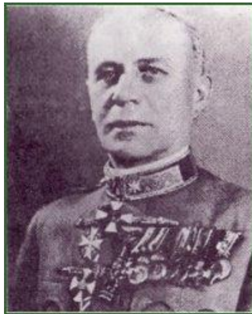
Vitéz Ferenc Feketehalmy- Czeydner (командант Рације)