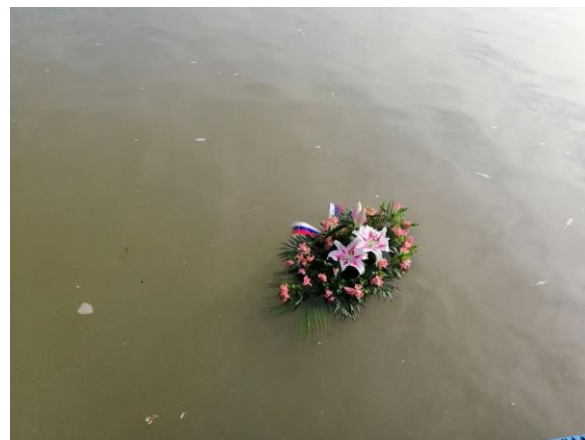
Тиса код Титела