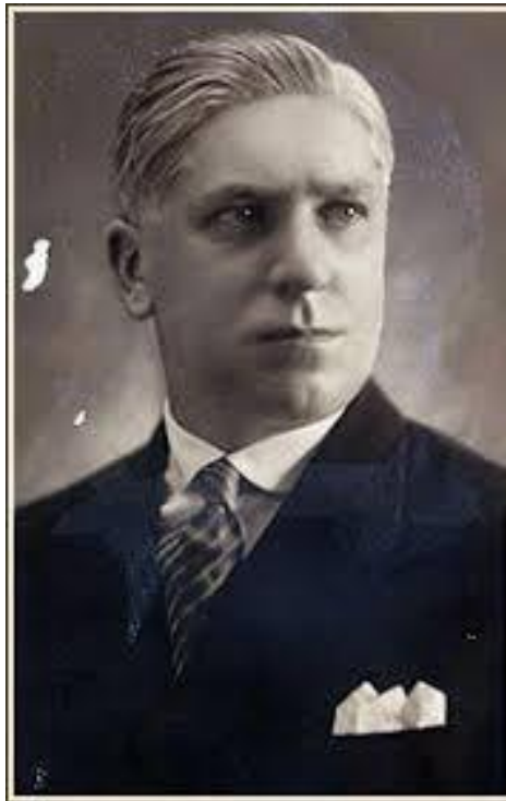
Endre Kálmán Bajcsy-Zsilinszky (одХортијевог сарадника до антифашисте)

Из писма премијеру Гардошију: „Требало би да подигнем свој глас протеста против оног начина, против оног садистичког германског стила, против нечовечности и противзаконите, неодговорне акције и крвопролића, услед чега је ради одмазде због жабаљског устанка безначајних размера побијено наводно 1800 српских душа, међу којима је било и недужне деце, одојчади. жена и девојака.” 19. јануар 1942.