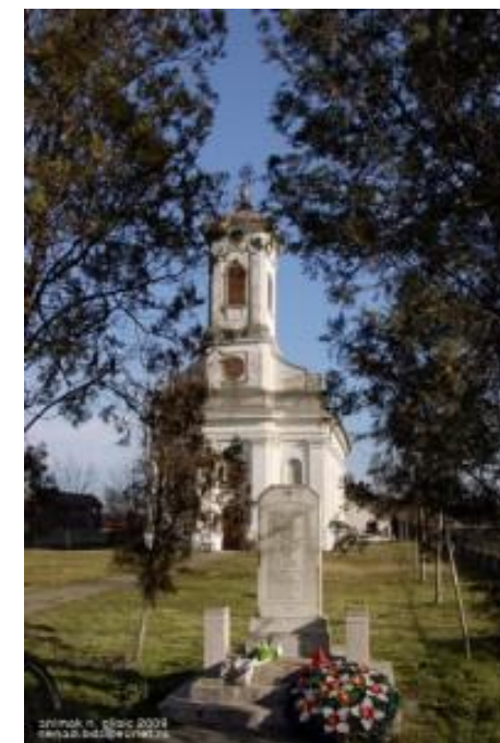
Л о к