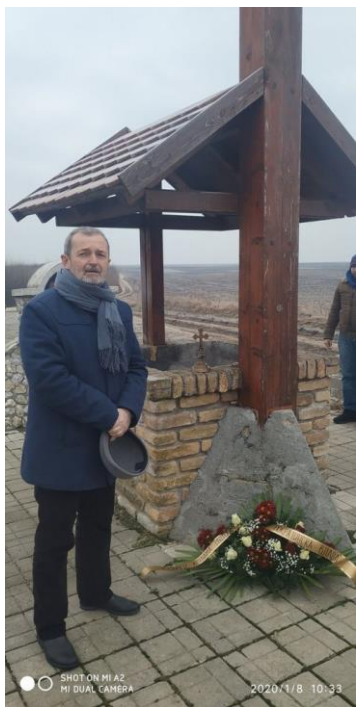
М о ш о р и н