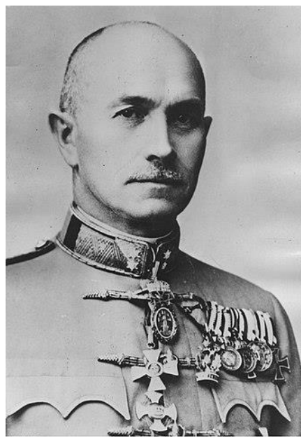
Ferenc Szombathelyi, рођен као Ferenc Knausz или Ferenc Knauz (начелник генералштаба)

„Уопште се може рећи да је већи део становништва злонамеран, балкански, за кога не би било штета ако би нестало са лица земље.”