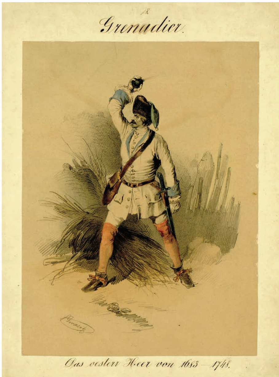
Литографија – војник бомбаш (АВ, Ф. 501, 8)