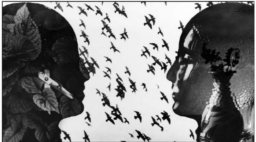
Слобода мишљења 1 , ц/б фотографија, 20×30 цм, 1991.

Чесменска 18/2 32300 Горњи Милановац 061 116 04 35