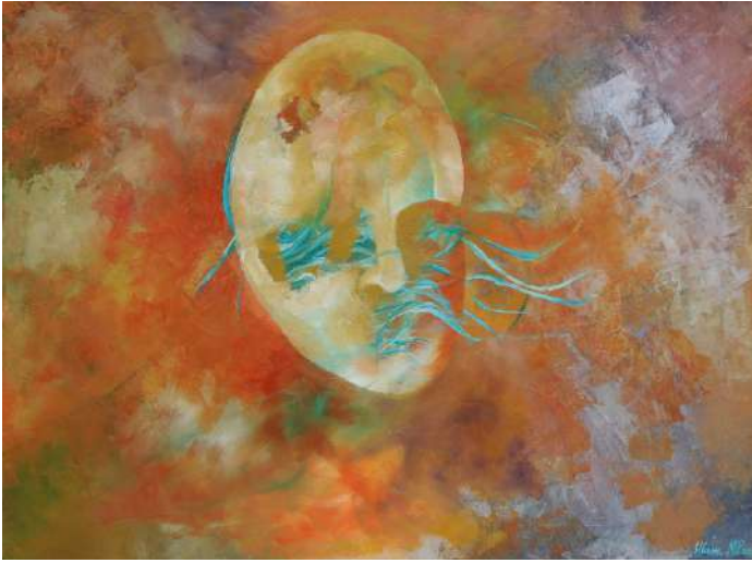
Без заташкавања , уље на платну, 2019.