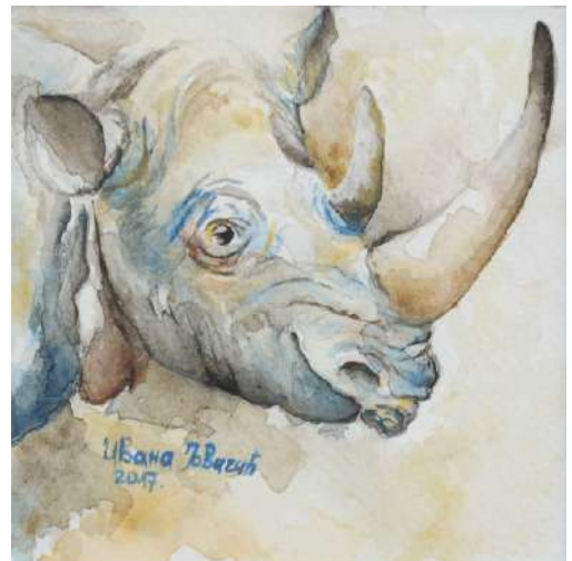
Носорог , акварел, 10×10 цм, 2017.

Рајићева 16 32300 Горњи Милановац 063 77 63 587 saxsasavovic@gmail.com