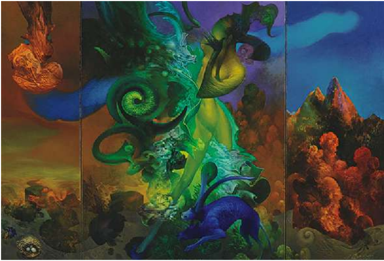
Медитеран и младост уље на платну, 96x66 цм, 2001.