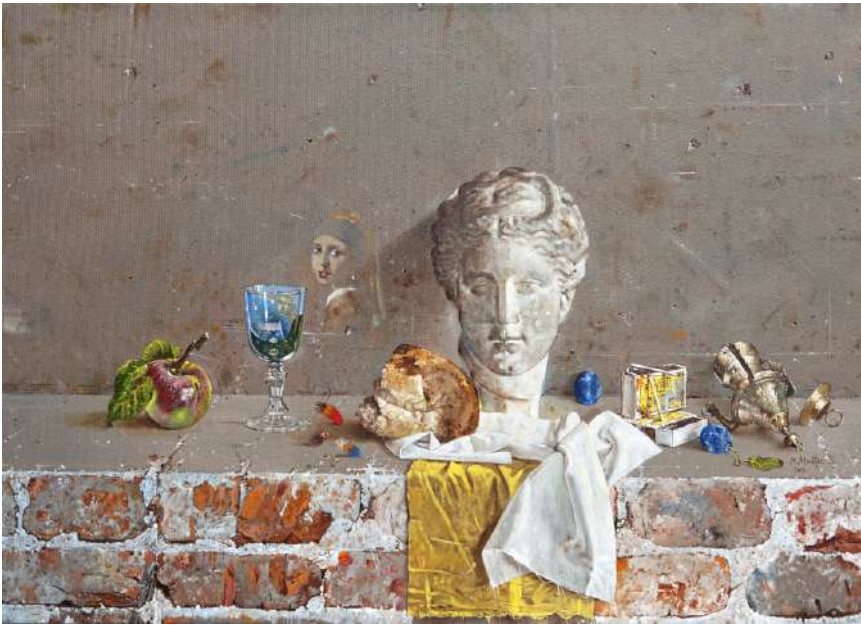
Девојка са бисерном минђушом , уље на платну, 50×70 цм, 2016.

Хлеб и вино и Свети Трифун , уље на платну, 50×40 цм, 2019.