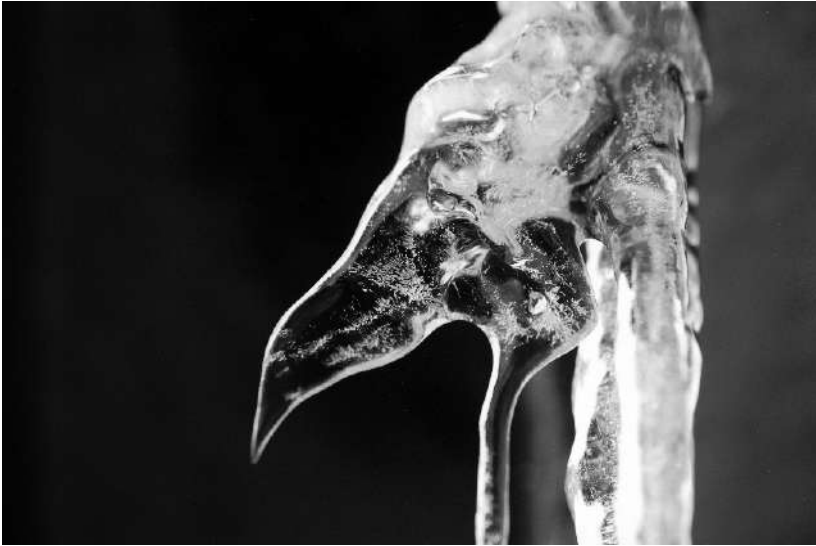
Тужни петао , ц/б фото, 20×35 цм, 2010.