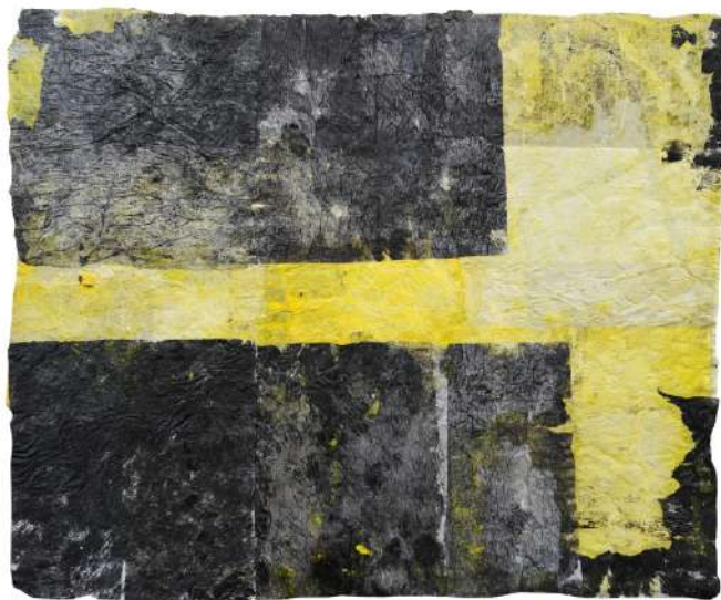
Запис воде I , комбинована техника, 55×45 цм, 2019. Запис воде II , комбинована техника, 55×45 цм, 2019.