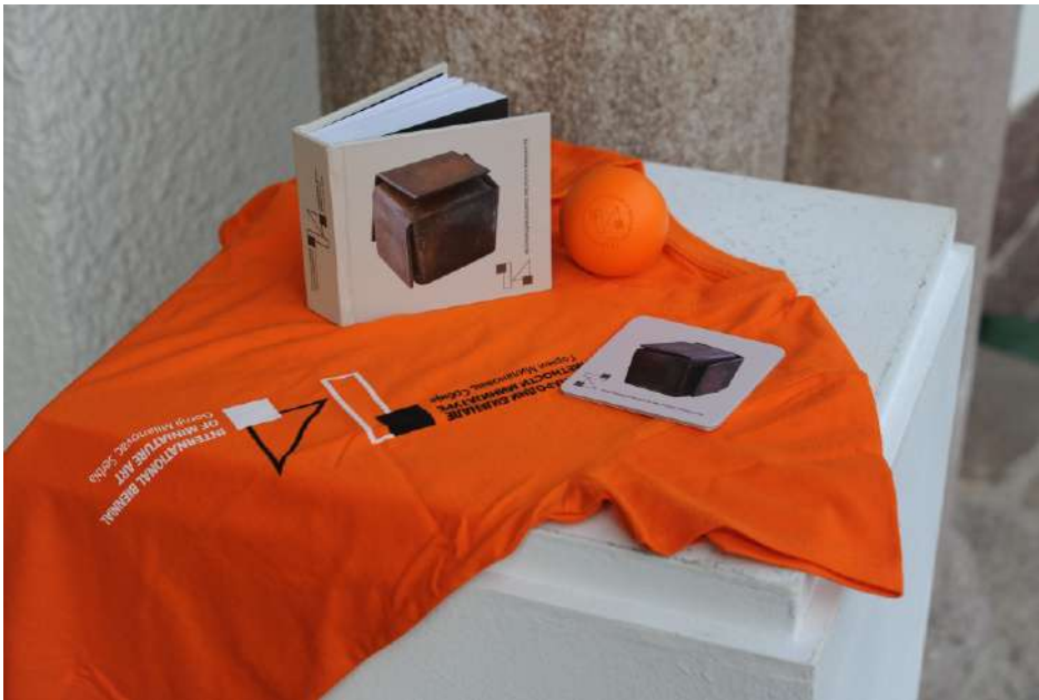
Каталог и сувенирски програм 14. Бијенала уметности минијатуре комбинована техника, 2018.