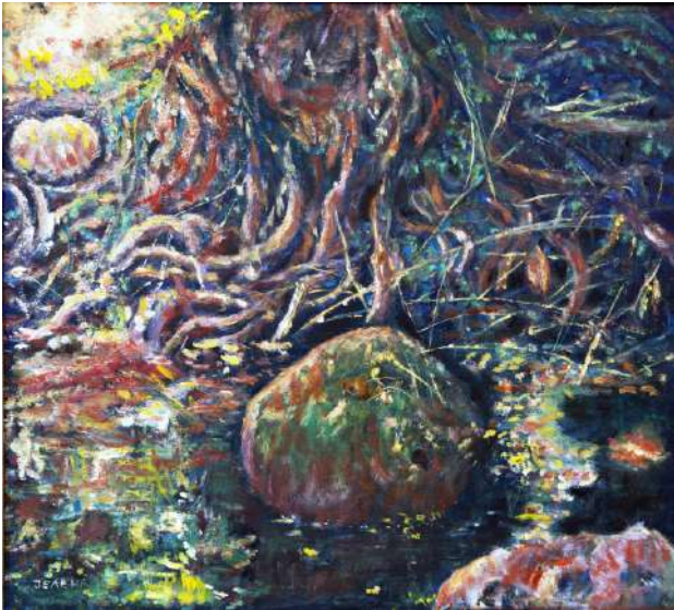
Жиле старе врбе и катен, уље, 45×50 цм, 2015.