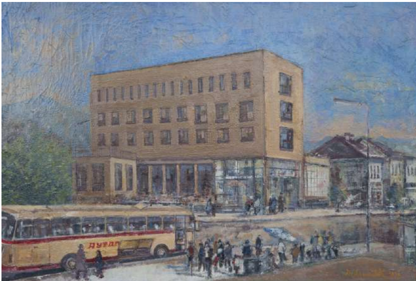
Центар Горњег Милановца уље на платну, 90×110 цм, 1979.