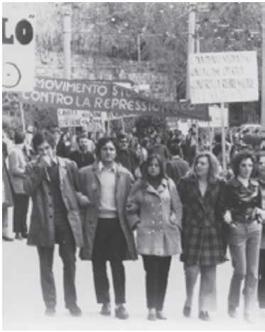
1968. Studentski protest protiv represije