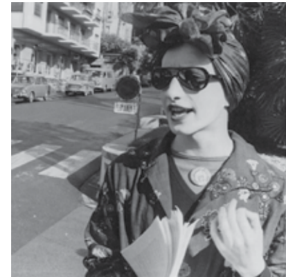
Mario Mieli (1952-1983)

Karakteristike feminističkih publikacija: ženske i rodne studije kao naučna interdisciplina.