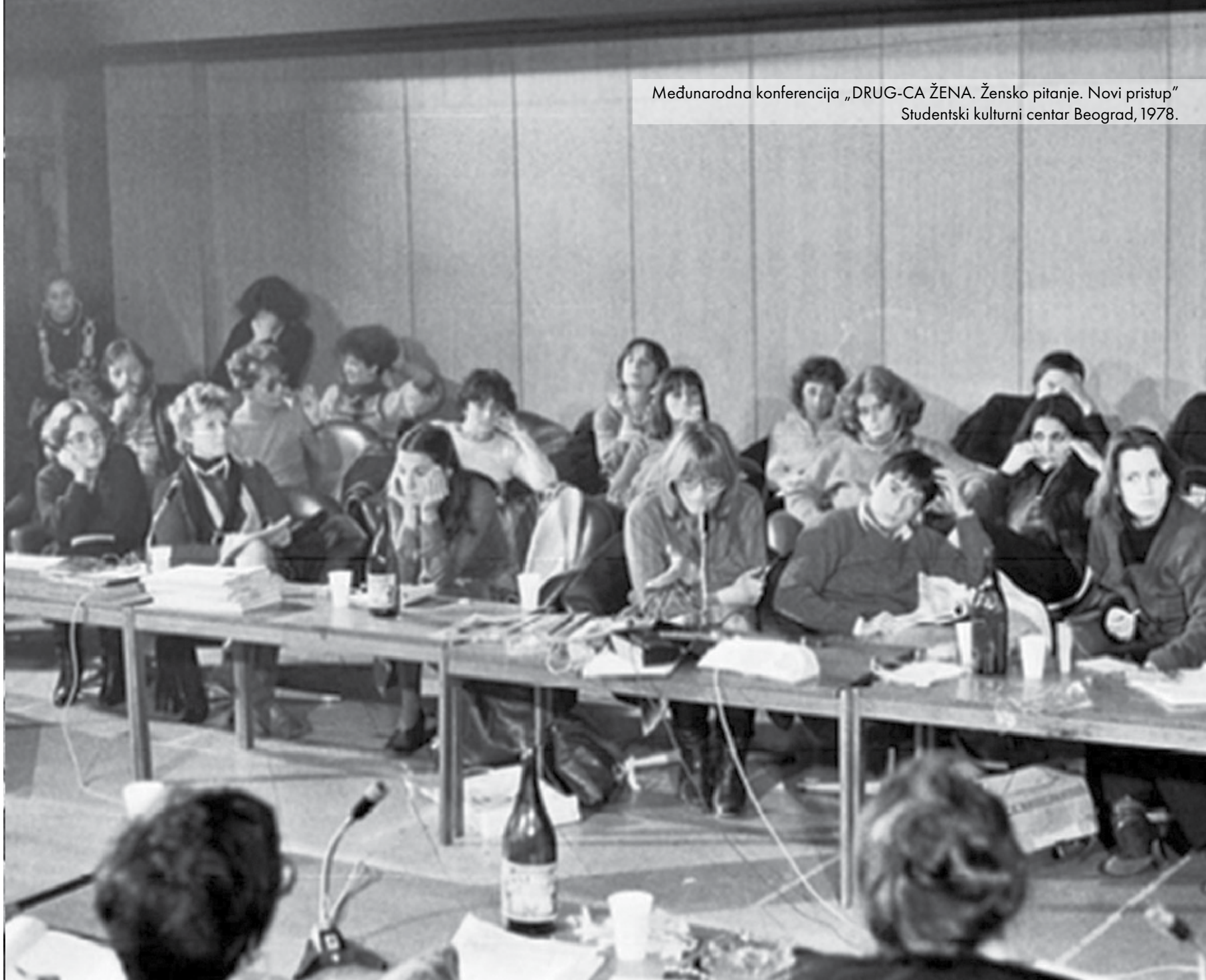
Međunarodna konferencija „DRUG-CA ŽENA. Žensko pitanje. Novi pristup“ Studentski kulturni centar Beograd, 1978.