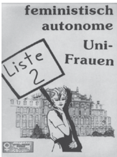
Pemifer Frauenreferat Frankfurt

Tokom 1974. godine održavaju se prvi „ženski seminari“, na univerzitetima u Berlinu, Minsteru, Frankfurtu, Minhenu... Podstrek za njihovo pokretanje dolazi od studentkinja koje su aktivne u ženskim centrima. Alis Švarcer predaje sociologiju na Univerzitetu u Minsteru i organizuje prvi ženski seminar o seksualnosti.