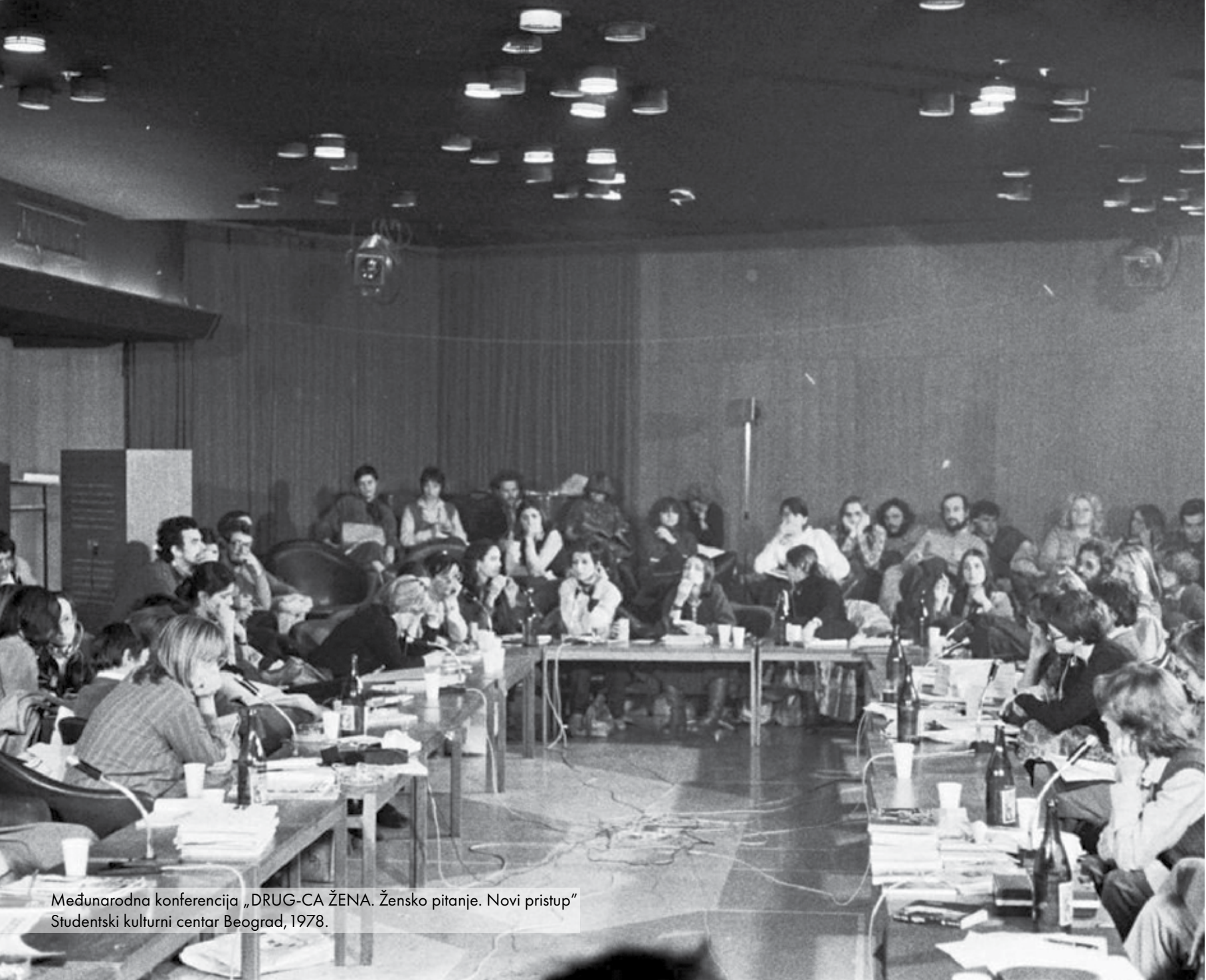
Međunarodna konferencija „DRUG-CA ŽENA. Žensko pitanje. Novi pristup“ Studentski kulturni centar Beograd, 1978.