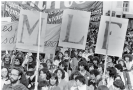
Pokret za oslobođenje žena (Mouvement de libération des femmes - MLF)

godine, osnovala je Visoku školu za ženske studije 1978. godine, 1980. Ženski naučno-istraživački institut i Opservatoriju mizoginije 1989. godine. Istovremeno, njeno zalaganje za oslobođenje žena dovelo ju je do brojnih aktivnosti u oblasti izdavaštva, pa je 1972. godine pokrenula Editions des femmes , prvu žensku izdavačku kuću u Evropi. Cilj izdavačke kuće od početka je bio i književni i politički: promocija književnog stvaralaštva žena i borba žena za unapređenje vlastitog položaja. Otvorene su istoimene knjižare u Parizu (1974), Marseju (1976) i Lionu (1977). Napravila je prvu zbirku audio knjiga u Francuskoj La Bibliothèque des voix (1980). Učestvovala je u izdavanju novina Le Quotidien des femmes (1974–1976) i mesečnika, a zatim nedeljnika Des femmes en mouvement (1977–1982).