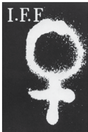
I.F.F. Bielefeld, flojer

IFG je nezavisni istraživački institut koji osim što sprovodi različita naučna istraživanja koja se tiču društvenog položaja žena i mehanizama njihove diskriminacije, nudi praktične predloge koji mogu dovesti do većeg učešća žena u društvenom životu i većoj vidljivosti njihovog doprinosa političkom,