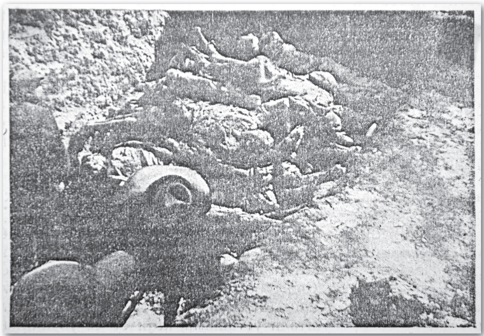
ФОТОГРАФИЈА ЕКСХУМАЦИЈА У ВУКОВАРУ