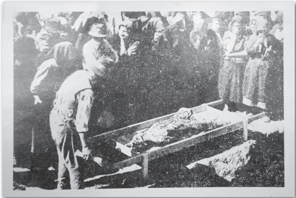
ФОТОГРАФИЈА – ЕКСХУМАЦИЈА У СРЕМСКОЈ МИТРОВИЦИ – ОТКОПАНЕ ЖРТВЕ ПРЕНОСЕ У НОВУ ЗАЈЕДНИЧКУ ГРОБНИЦУ