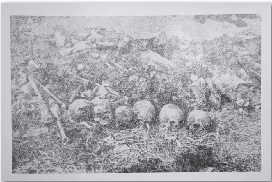
ФОТОГРАФИЈА – ПОЧЕТАК ЕКСХУМАЦИЈЕ НА ГРОБЉУ У СРЕМСКОЈ МИТРОВИЦИ, ПРВИ ИЗВАЂЕНИ ЛЕШЕВИ