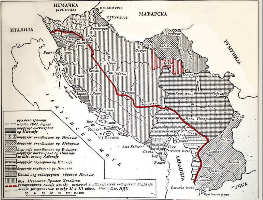
МАПА - ПОДЕЛА КРАЉЕВИНЕ ЈУГОСЛАВИЈЕ ИЗМЕЂУ НЕМАЧКЕ, ИТАЛИЈЕ И ЊИХОВИХ САВЕЗНИКА АПРИЛА 1941. ГОДИНЕ

ИЗМЕЂУ НЕМАЧКЕ, ИТАЛИЈЕ И ЊИХОВИХ САВЕЗНИКА АПРИЛА 1941. ГОДИНЕ