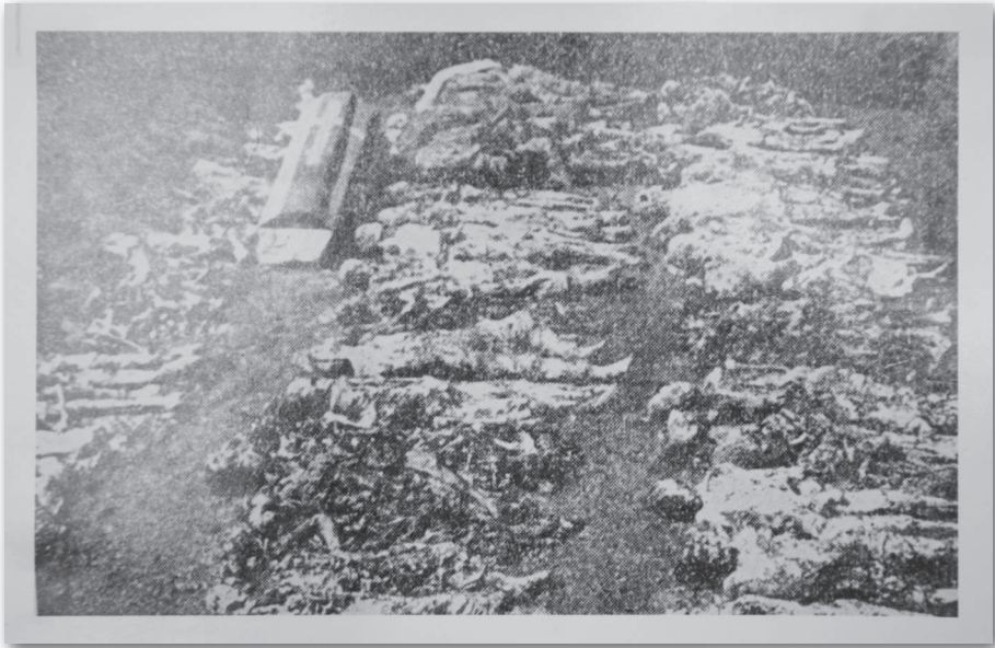
ФОТОГРАФИЈА – ПОЧЕТАК ЕКСХУМАЦИЈЕ НА ГРОБЉУ У СРЕМСКОЈ МИТРОВИЦИ – ЛЕШЕВИ ПРЕНЕТИ У НОВУ ЗАЈЕДНИЧКУ ГРОБНИЦУ