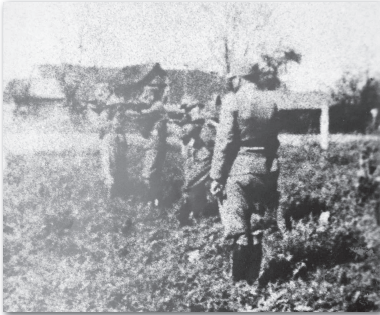
ФОТОГРАФИЈА – ВОД УСТАШКЕ ЖАНДАРМЕРИЈЕ У ТРЕНУТКУ СТРЕЉАЊА РОДОЉУБА НА ГРОБЉУ У СРЕМСКОЈ МИТРОВИЦИ У ВРЕМЕ ТОМИЋЕВЕ АКЦИЈЕ