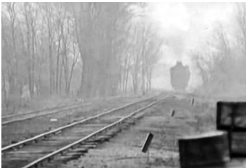
Улазак воза у железничку станицу Бољевци.

пасуља, 300 кг кудељног семена, 150 кг чисте вуне, 170 јањећих кожа, 32 овчије коже, сав механички прибор са свих економских и пољопривредних машина и већу количину кукуруза у клипу, пшеницу, брашно и разне друге ствари. 222