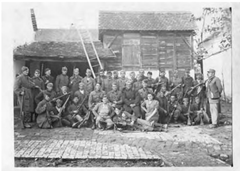
Партизани у авлији Јана Литавског, Добановци, крај рата

Ноћу између 31. XII 1943 и 1. I 1944. године I вод I чете исекао је 32 телефонска стуба између Сурчина и Бечмена, жице су покупљене и склоњене. 343