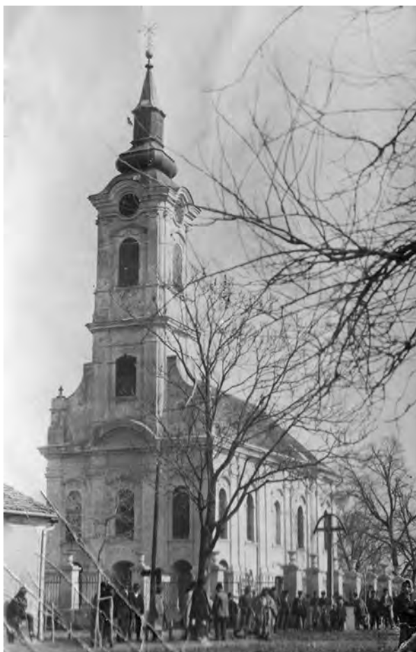
Српска црква, Добановци

и II сремског НОП одреда у времену од 30 септембра до 21 октобра 1943 год., Ратни извештај Главног штаба НОВ и ПО Војводине, 447–448.