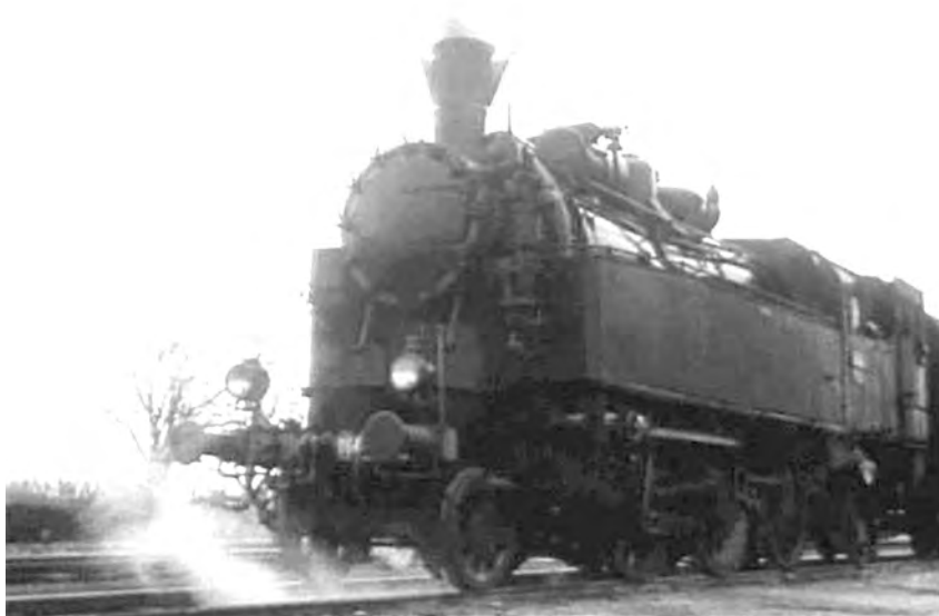
Локомотива на траси пруге Ст. Пазова – Батајница

па је одмах дошло до пушкарања. Убијено је 3 усташе, док су се остали разбежали. Рањен је један цивил, неки инжењер, који се налазио у друштву усташа. Због пуцњаве воз се није заустављао, али је један друг ускочио у воз у намјери да га заустави. Међутим, морао је брзо искочити, у чему се мало повредио. Заплењена је једна пушка „маузер” са 60 метака и 2 пара војничког одијела. У самој станици је излупан телеграф, телефон, уређај и заплијењено 60 куна. 145