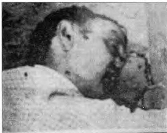
Србин из Петриње убијен испред своје куће.