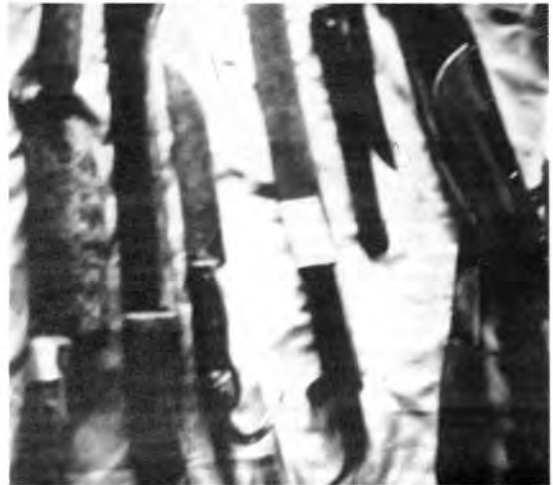
Предмети пронађени у складу ЗНГ-а у Вуковару.