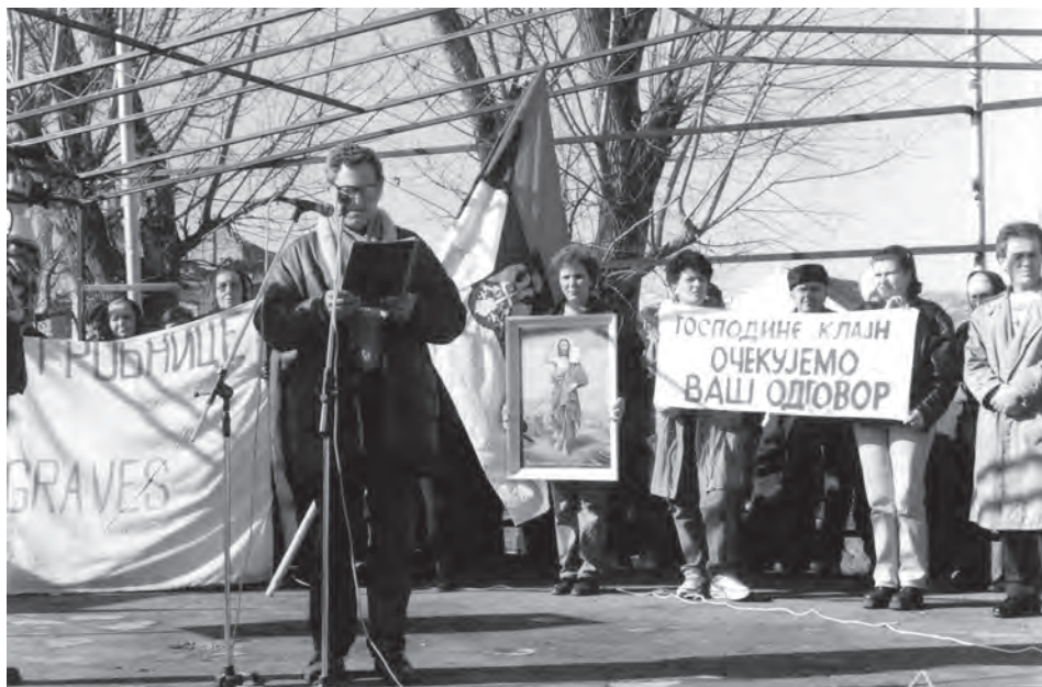
Слика са „Народної протестна – људска права свима”