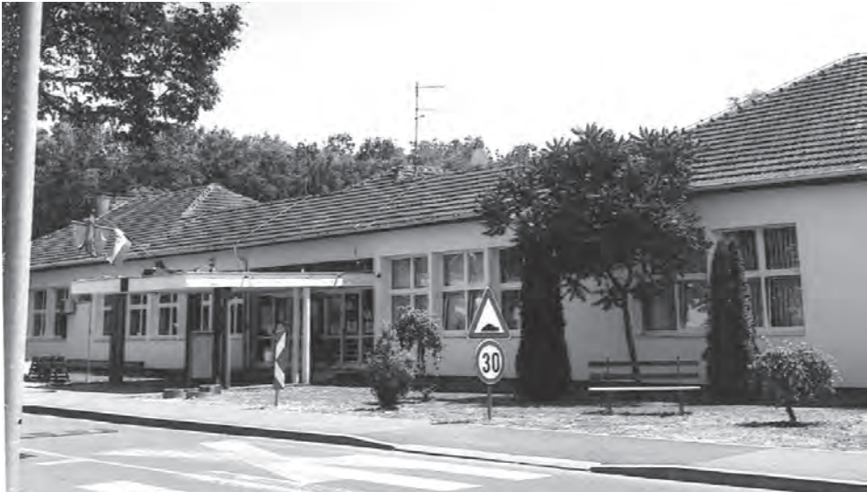
Зграда децјеј вртића у Борову насељу (у средини). Овде су извршена многа мучка убиства Срба.