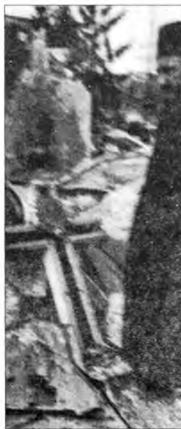
Отац Перо на згаришту цркве Светог Спиридова у Петрињи.