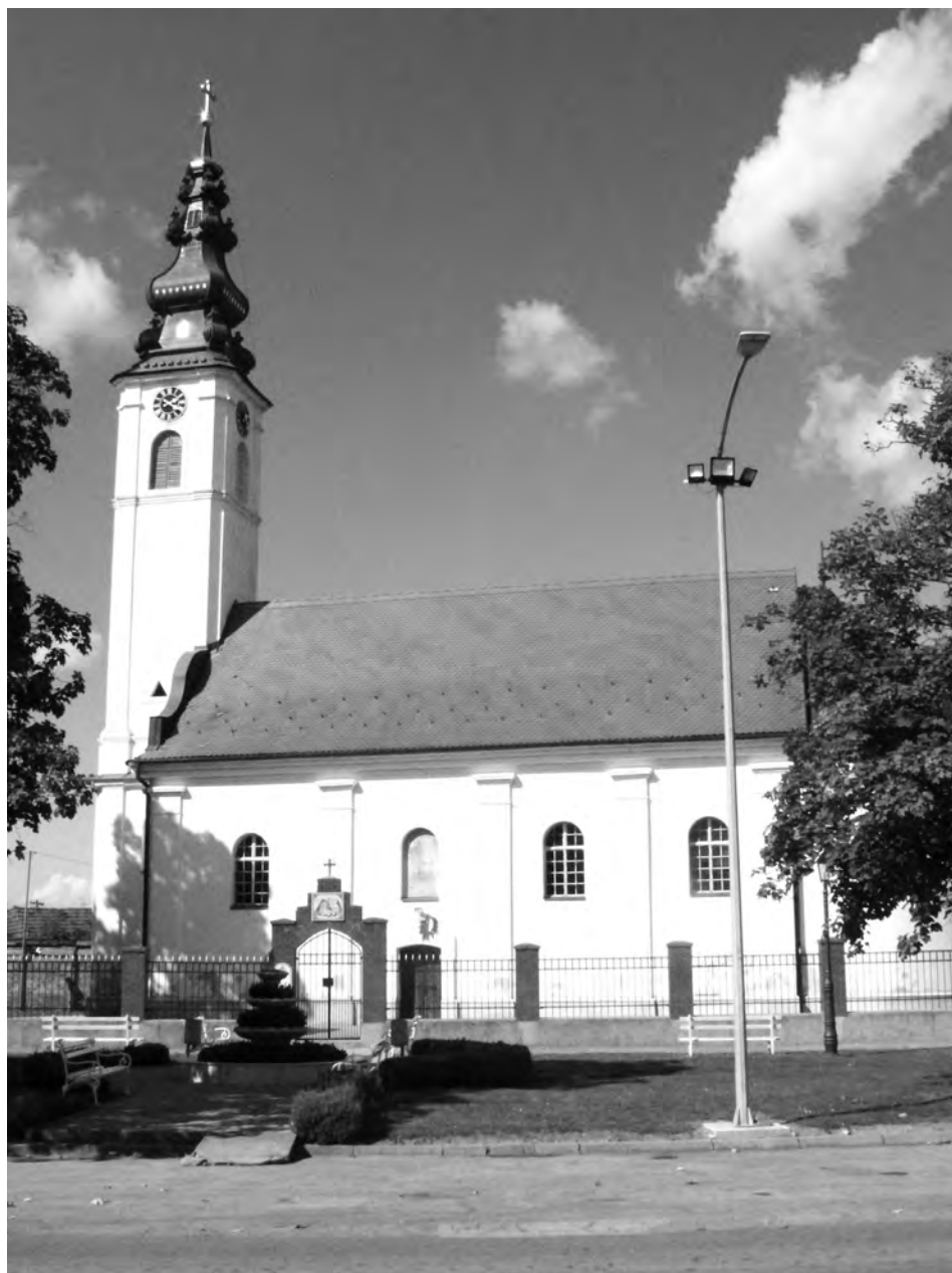
Црква Светиої Георгија у Бодоїти