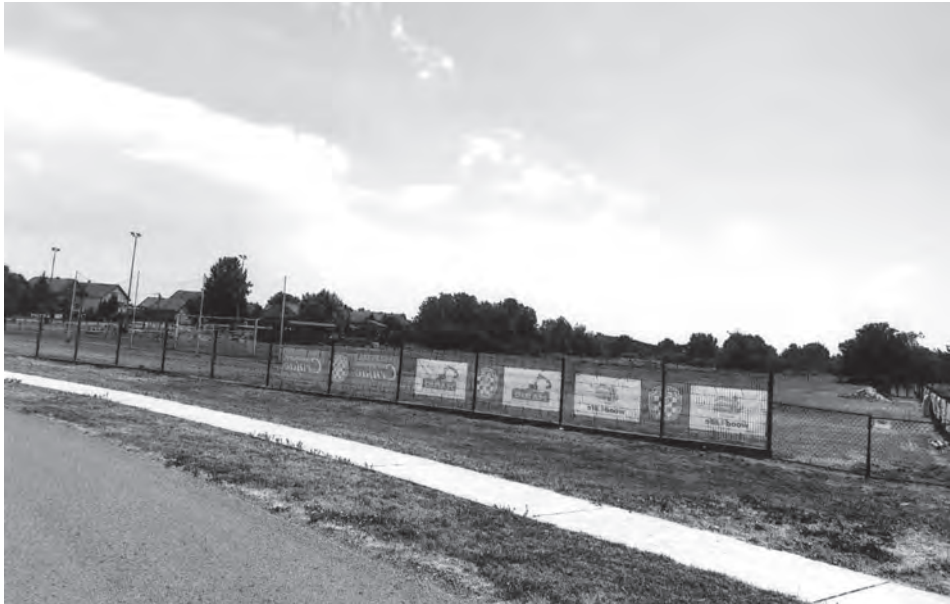
Тамо где су њадале мртве српске љаве, данас је фудбалски стадион клуба са Мишњице.

Народ ових подручја први пут је видео људе из разних земаља света: косооке, црне, плаво-црне, жуте... и били су својеврсна атракција само кратко време. После смо се на њих навикли као на нешто сасвим нормално, уобичајено – у стилу народне изреке: у Божијем тору свакојаким..., поготово што су многи од њих становали и хранили се у приватним кућама. Међутим, овакав састав Мировне мисије није одговарао Хрватској која све отворено оптужује за попуштање Србима и њиховим захтевима.