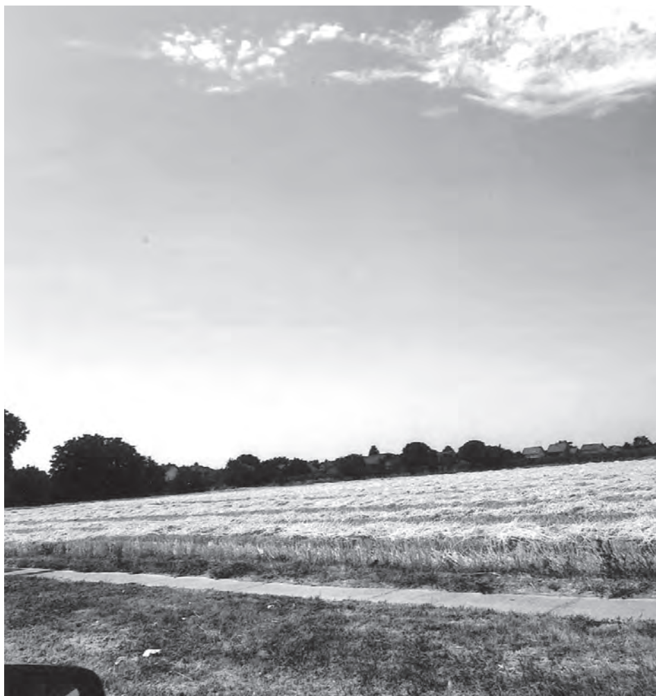
Поље на крају Козарачке и Херцејовачке улице – њрема Црејуљама и Борову. У близини је и њо злу чувена кафана „Слон”

Плахта спуштена, ми ћутимо и једемо помало. Поп пита Евице, ће су ти дјеца? Оче, ту су негде. Мачка нас је издала, мирисала јој палента. Ми смо видели мачку у здели и на сав глас викнемо – шиц. Поп рече ево ти дјеце под креветом. Изашли смо и пољубили крст како је ред, а мама се извинила. Мислим каво мала сам уз маму веровала у Бога, то је среће и Божја воља да ме кроз живот прати.