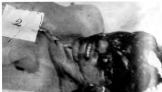
На слици са бројем 2 Мирко Лавадиновић, асистент на Шумарском факултету у Београду. Ухваћен и убијен 2. септембра 1991.