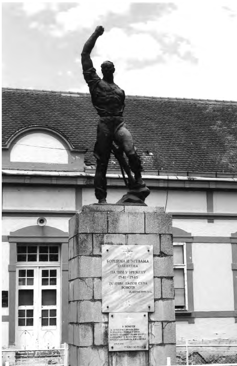
Сйоменик борцима НОР-а у Бобоџи