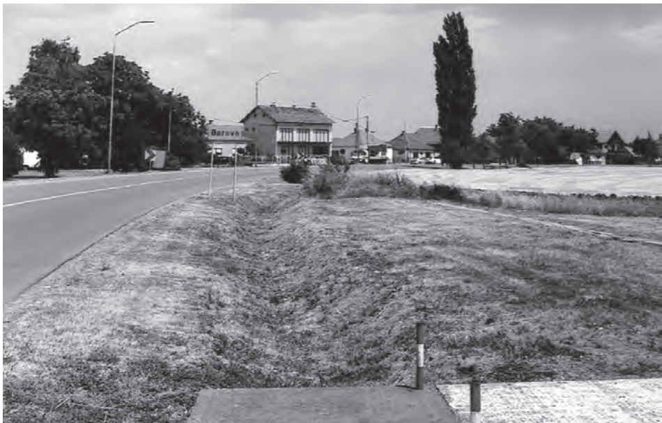
Црепуље: гео Борова њре њрује. Сџићи доведе, значио је сџас за мноје Србе из Борова насеља и Вуковара.