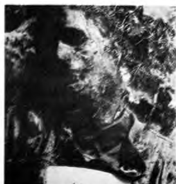
НН мушкарац, неутврђене старости. Страдао у рацији између 16. и 18. октобра 1991, убијен и спаљен.