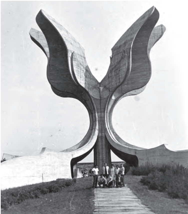
Сјомен-цвећ у Јасеновцу, сјомен-цвећу сјомен-цвећу хиљада Срба, Рома, Јевреја ...