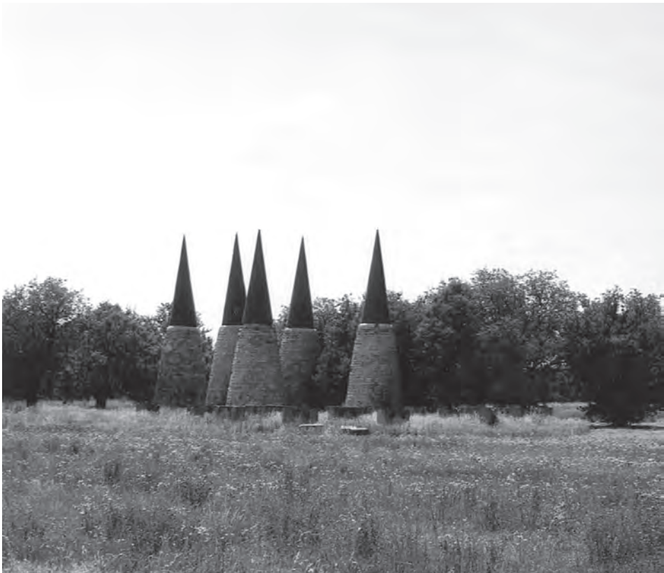
Сјоменик у Дукику, овде су убијени Срби Срема, Бачке, Вуковара и околних српских села у Друјом светском рају.