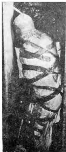
Српска девојка усмрћена гушећем чврсто омотаним лајтоном, Борово-насеље, новембар 1991. године.