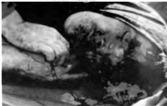
За сада неидентификована жртва усташких злочинца.