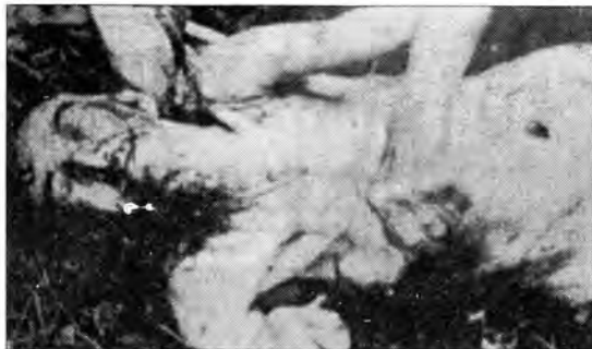
Даринка Кећ (1918. г.), убијена 5. августа 1991. у Доњим Куљанима - Костајница, општина Двор на Уни.