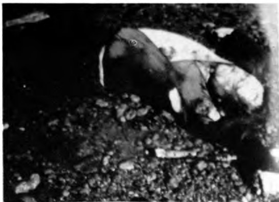
Леш Здравка Дедића извучен на обалу Дунава близу Сремске Каменице, 17. октобра 1991.