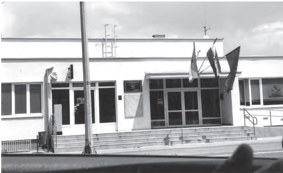
Зграда МЗ „Брајство и јединство” – преименована у „Алојзије Степинац” Овде су се рађале монструозне идеје о „чишћењу” Срба у Борову насељу.