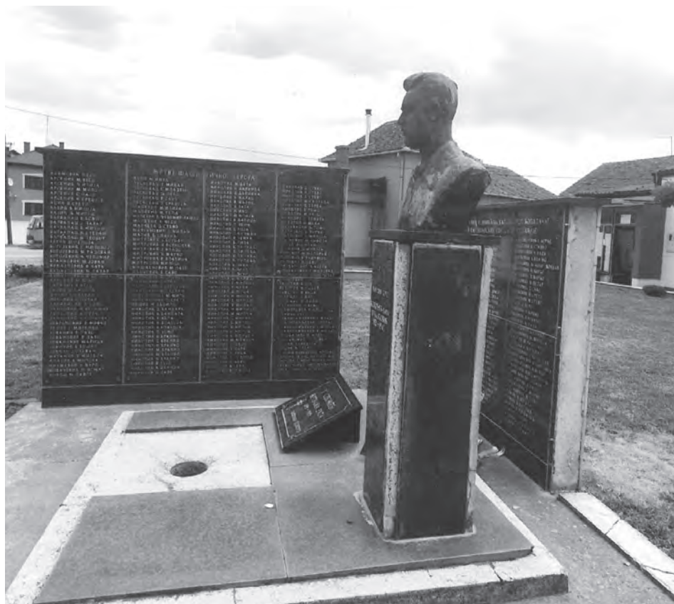
Споменик борцима НОР-а у Бодошћи