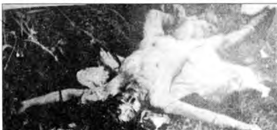
Невенка Берић (1930. г) заклана и масакирана у дворишту своје куће 5. августа 1991. у Доњим Куљанима - Костајница, општина Двор на Уни.