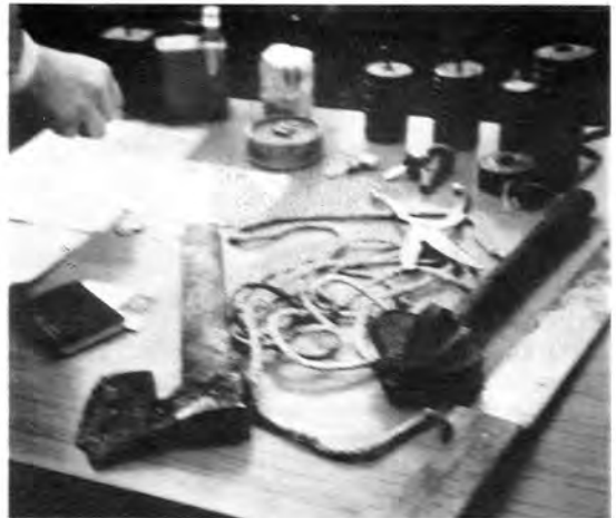
Експлозивна средства ручне израде, секира и нож (са траговима крви), буздован, крвави конопац, маказе за тортуру и лични предмети припадника ЗНГ-а.