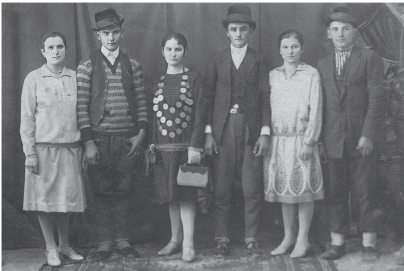
Валентировићи и Вркатићи.