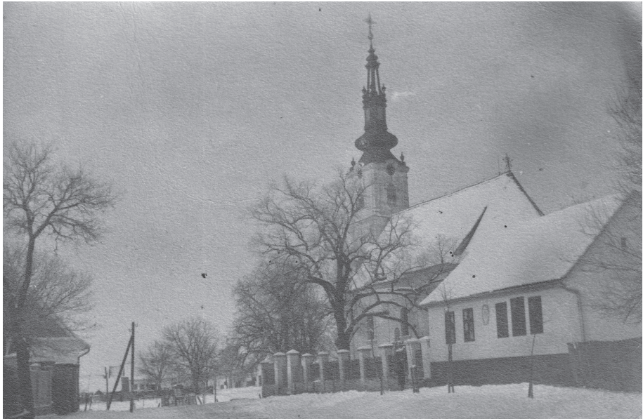
Центар Беркасова 1940. године.