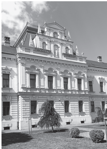
Слика 8. Зграда у којој су 1991. године били Општински Суд и Полиција