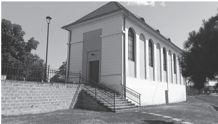
Слика 10. Зграда Клуба дизача тегова у којој су мучени и убијани цивили Срби