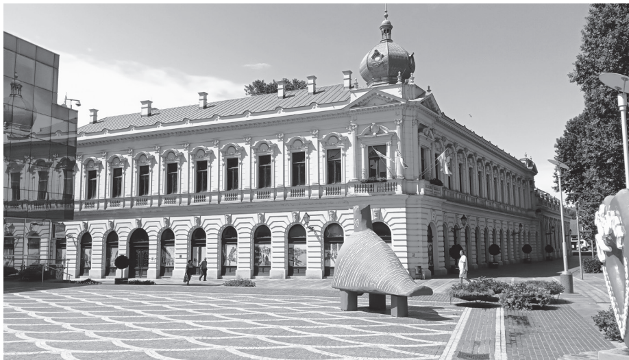
Слика 3. Раднички дом