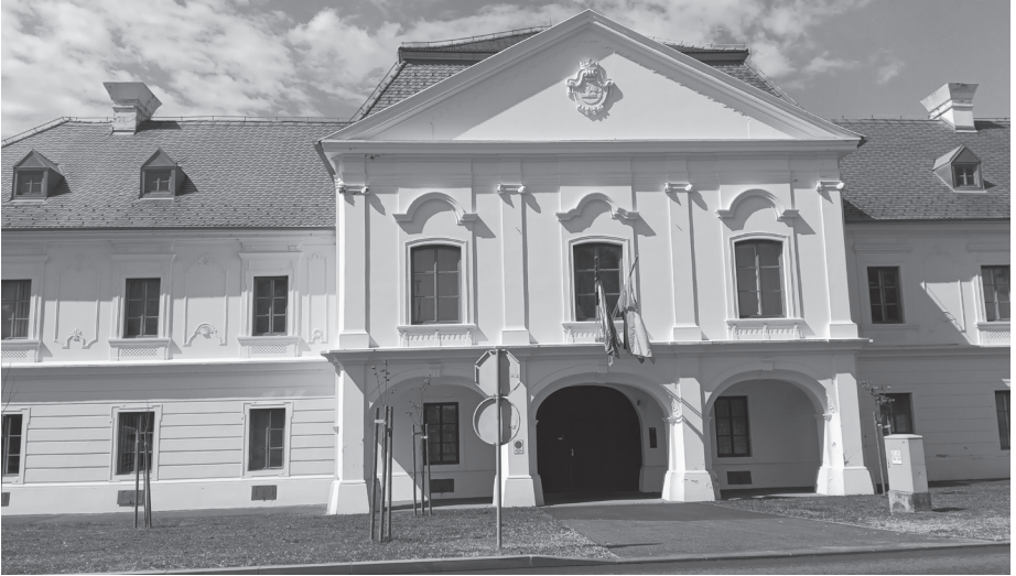
Слика 1. Зграда СО Вуковар