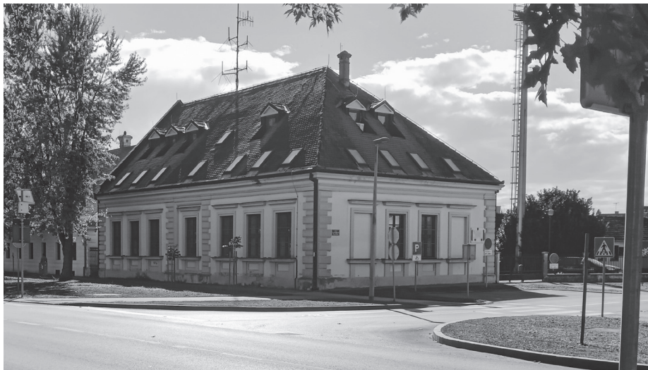
Слика 9. Штаб народне одбране којег је насилно окупирао Мерчеп