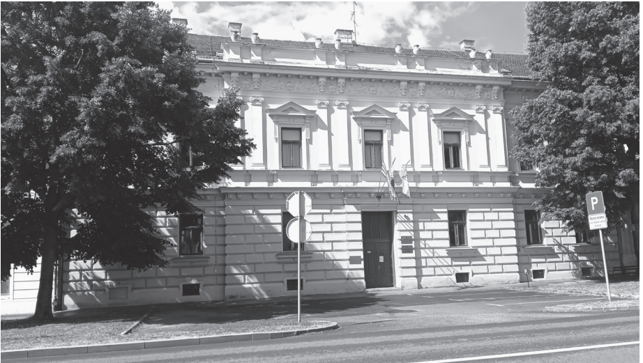
Слика 2. Зграда СО Вуковар