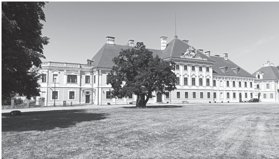
Слика 4. Дворац грофа Филип Карл фон Елтз - а