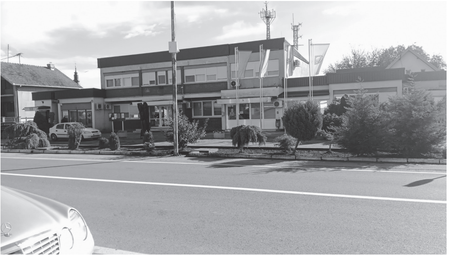
Слика 5. Борово село – место где је отпочео оружани напад Хрватских полицијских снага другог маја 1990.