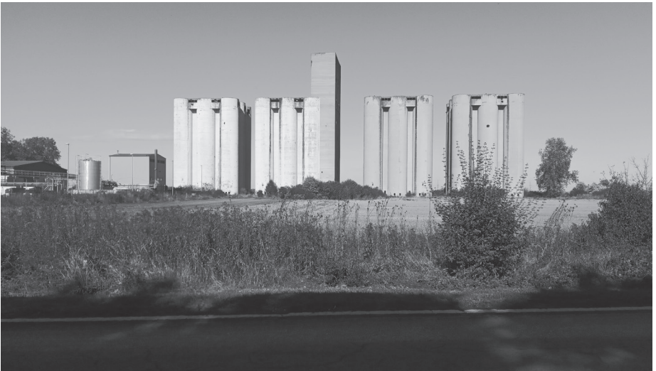
Слика 6. Силоси Бршадин које су заузели хрватски снајперисти