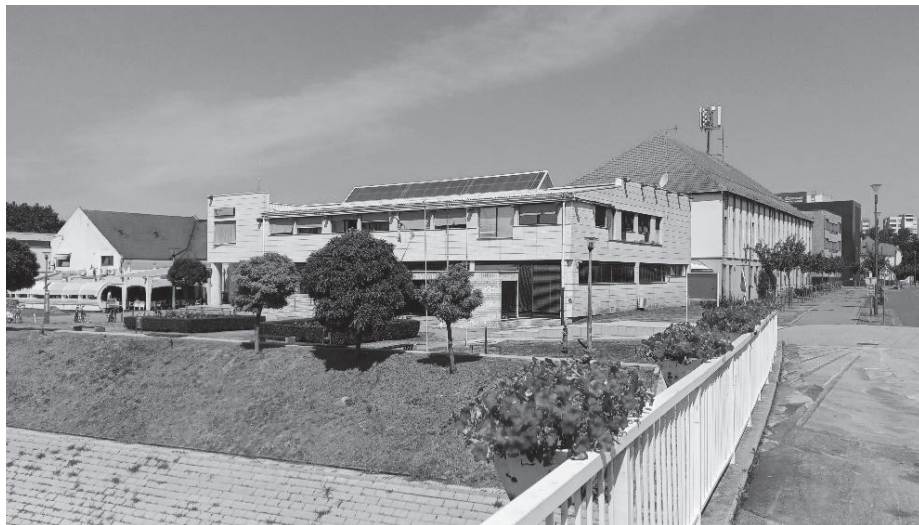
Слика 7. Зграда Поште у Вуковару