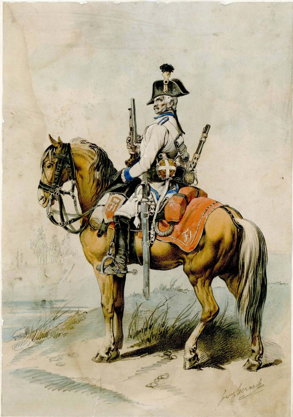
Das oester. Heer von 1790.