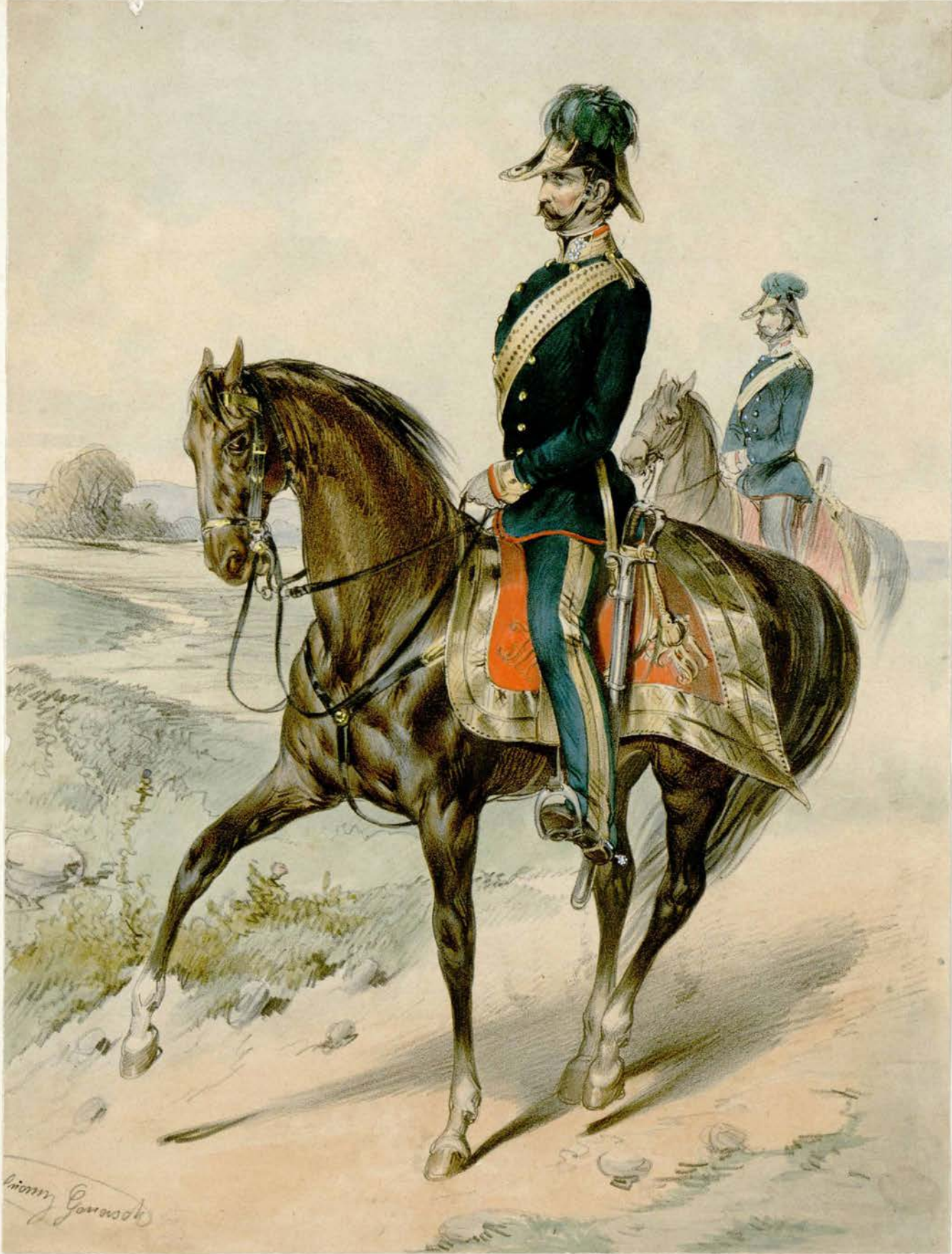
Das oester. Heer.