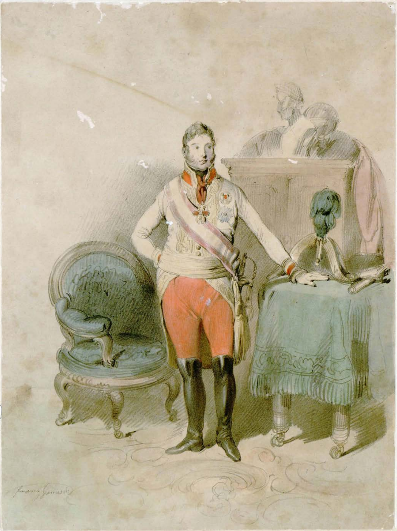
Das oesterr. Heer von 1809-1836.