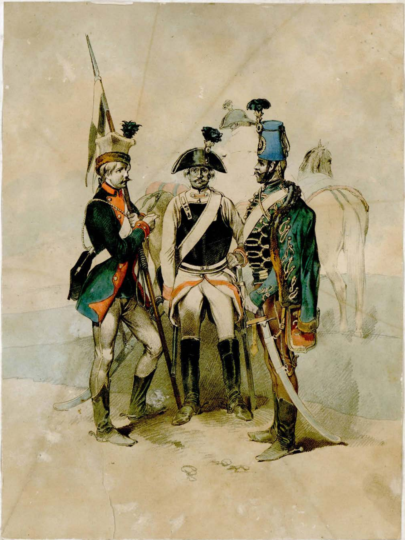
Das oester. Heer von 1790.