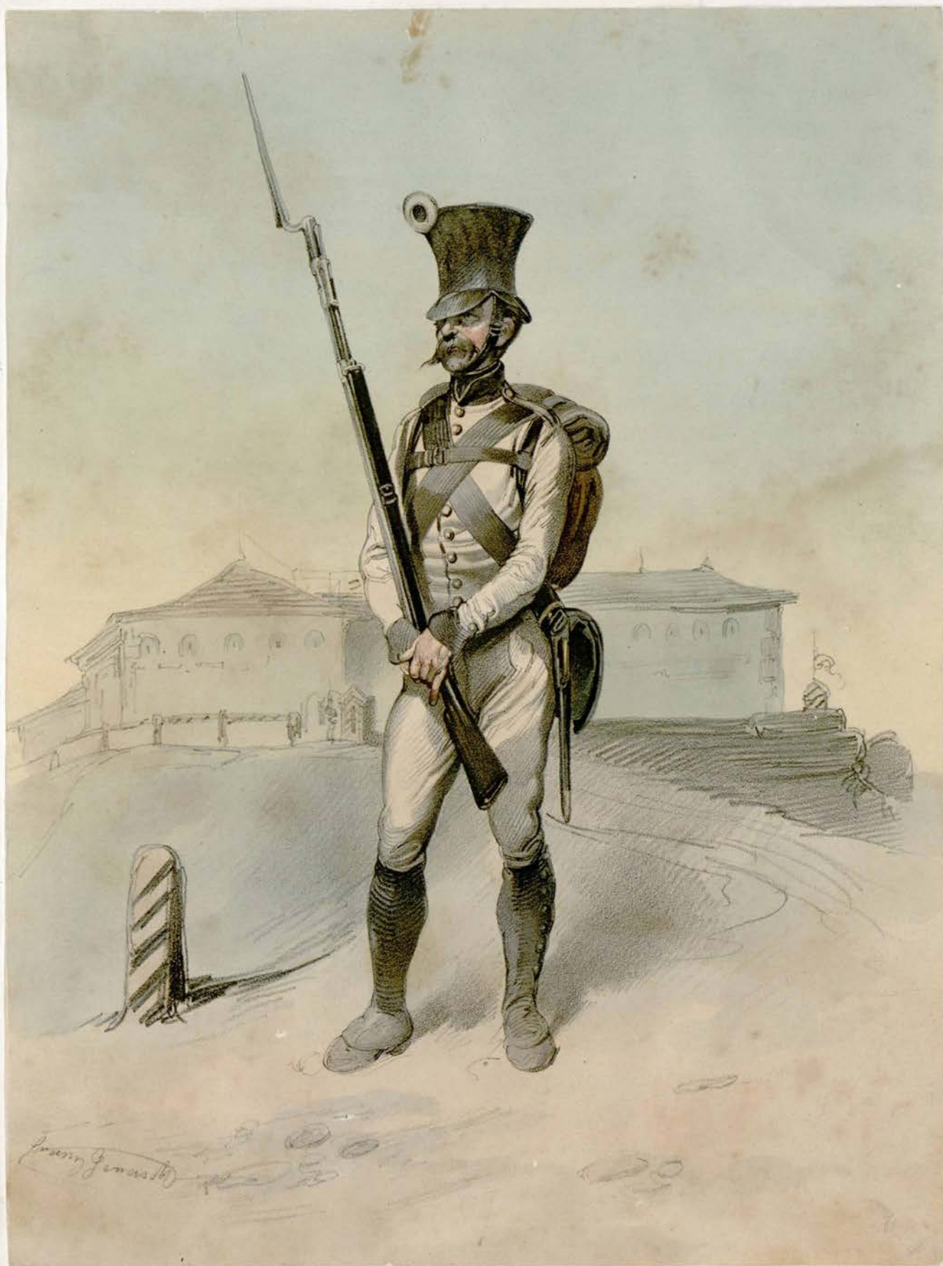
Das oesterr. Heer von 1809-1835.