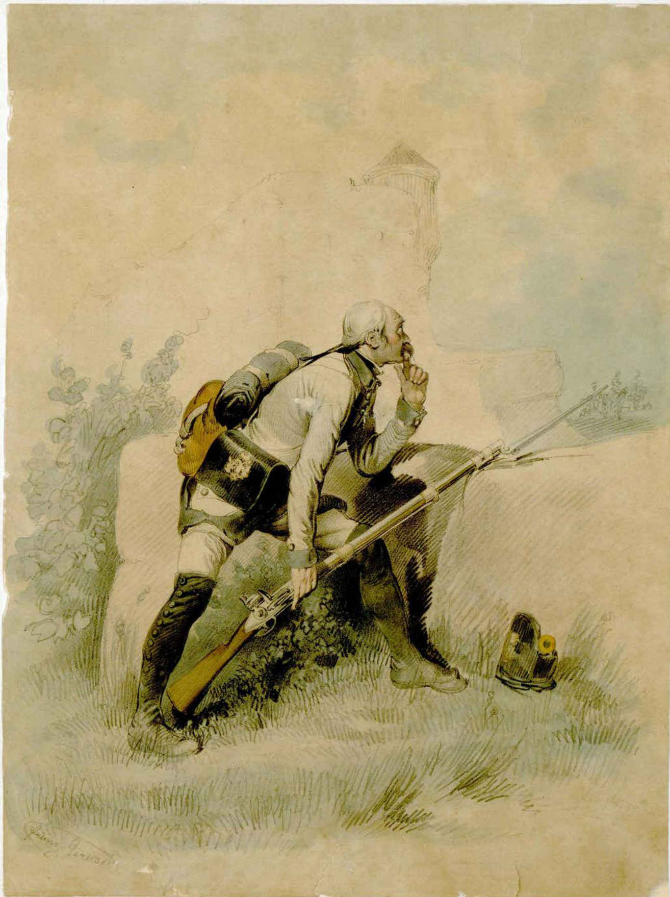
Das oesterr. Heer von 1790 - 1809.