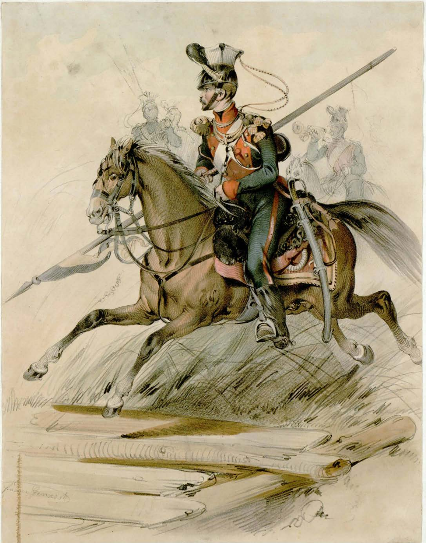
Das oester. Heer von 1835-1848.