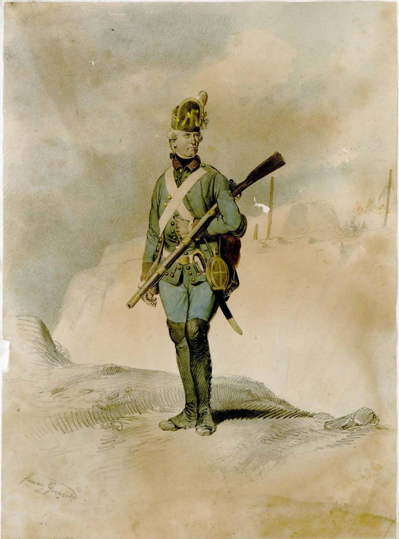
Das oester. Heer von 1750 - 1790.