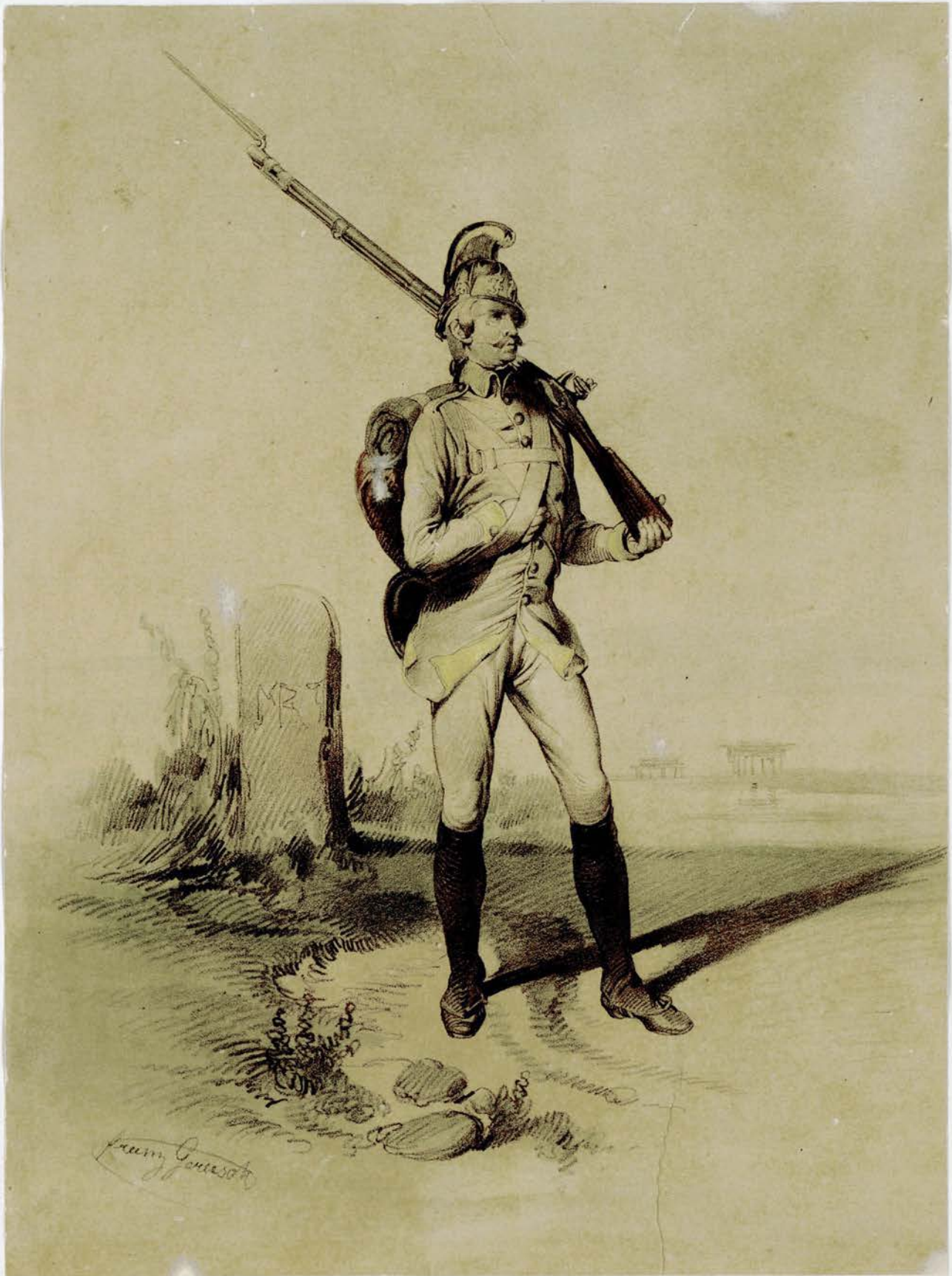
Das oesterr. Heer von 1790 - 1809.