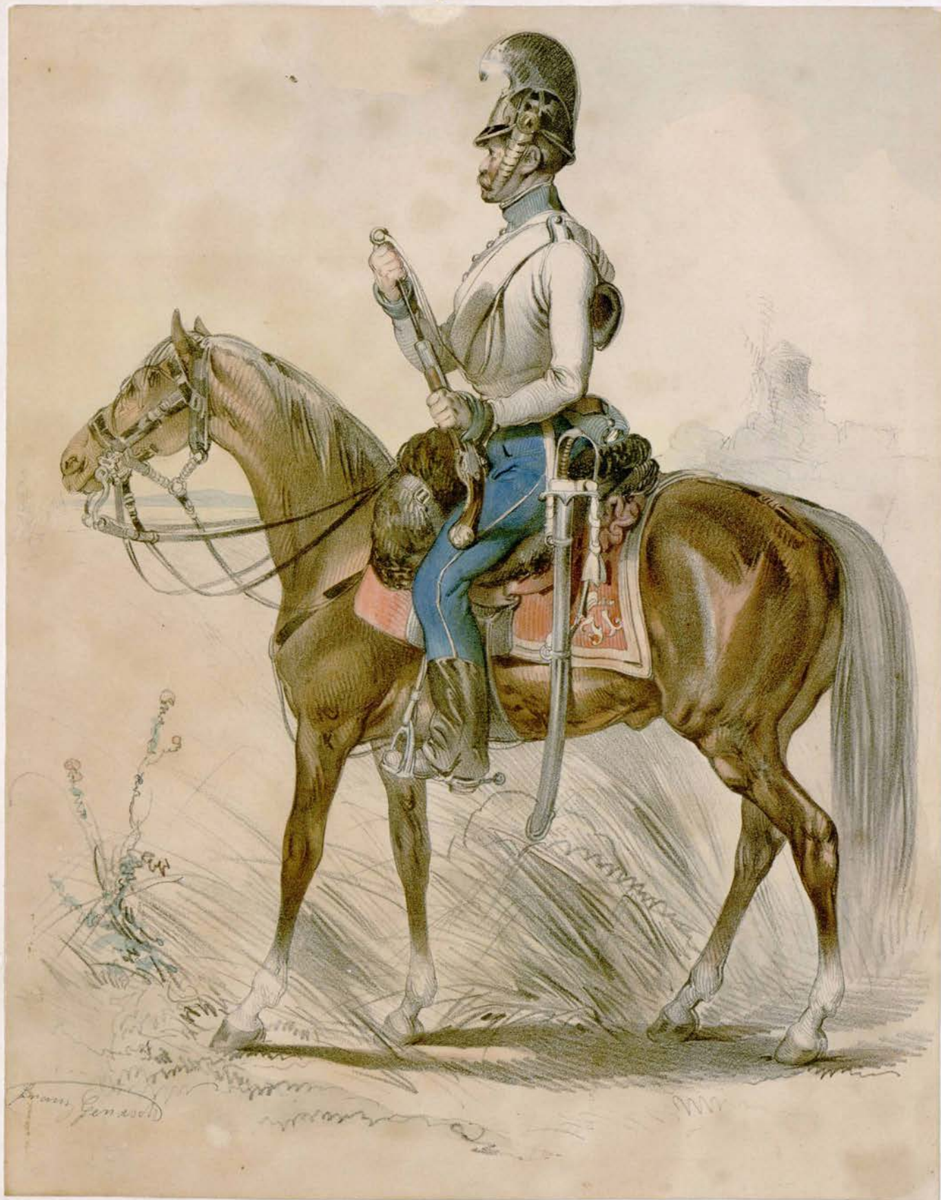
Das oesterr. Heer von 1835-1848.