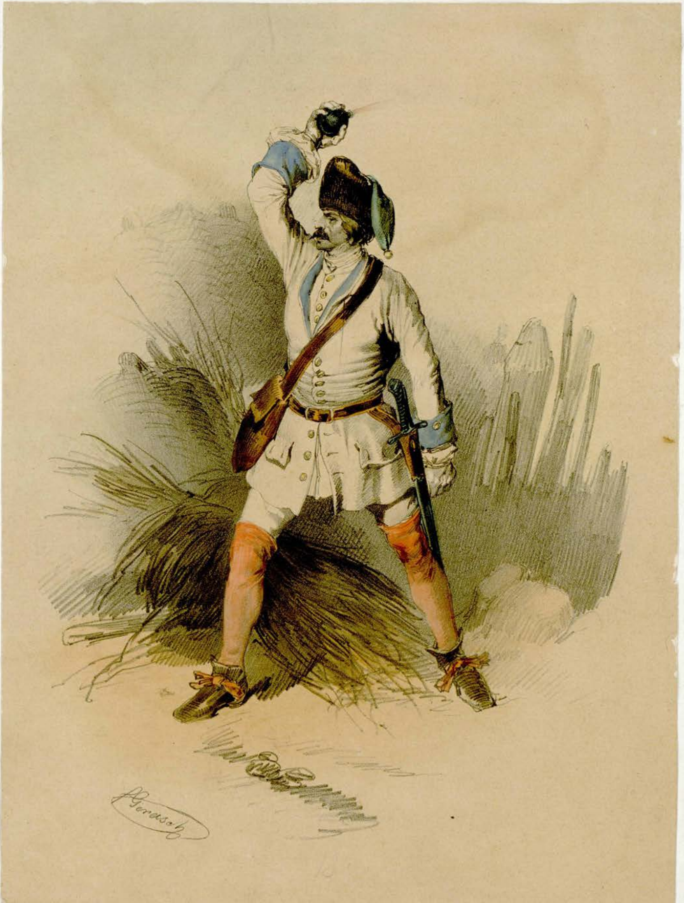
Das oesterreich Heer von 1683 — 1748.