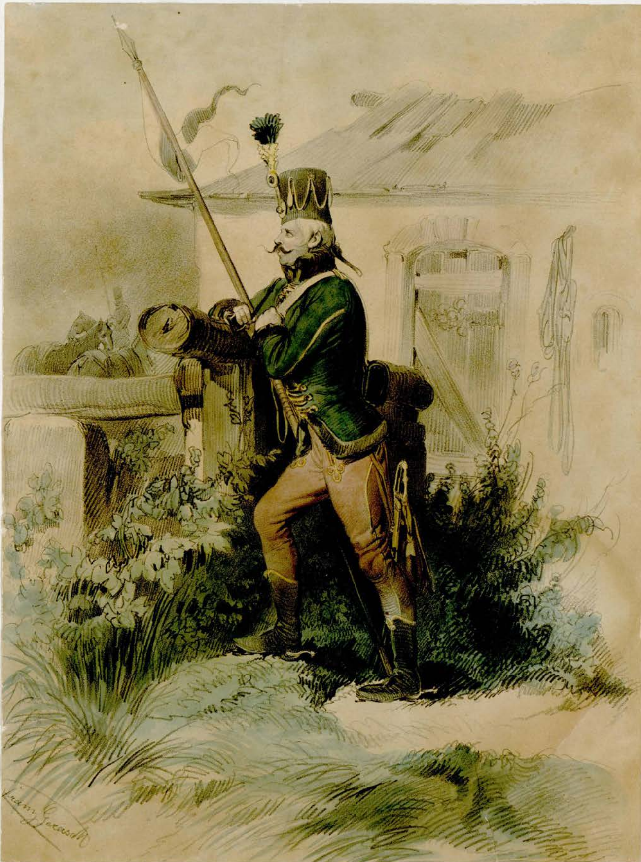
Das oesterr. Heer von 1750-1790.