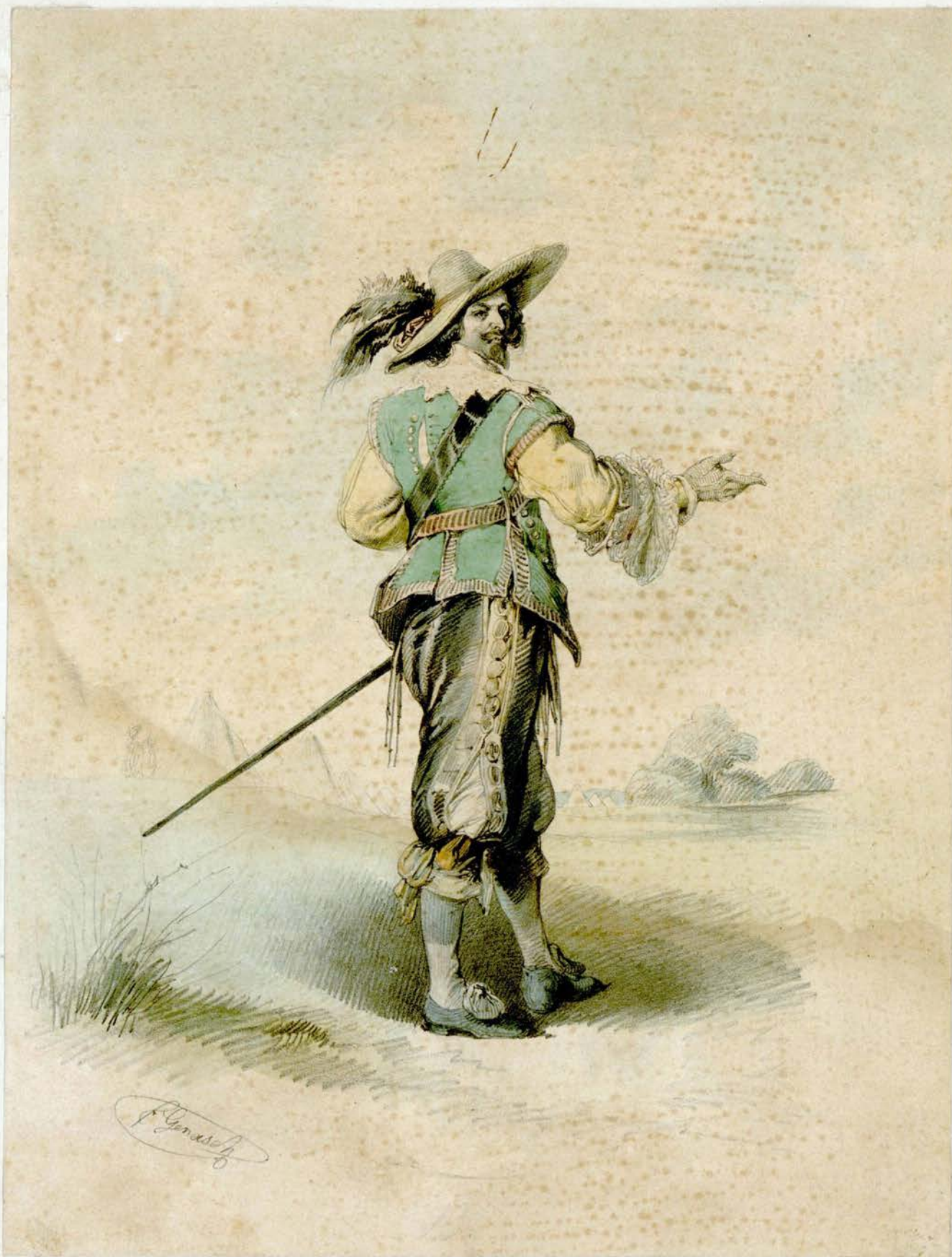
Das oester. Hier von 1620 - 1650.