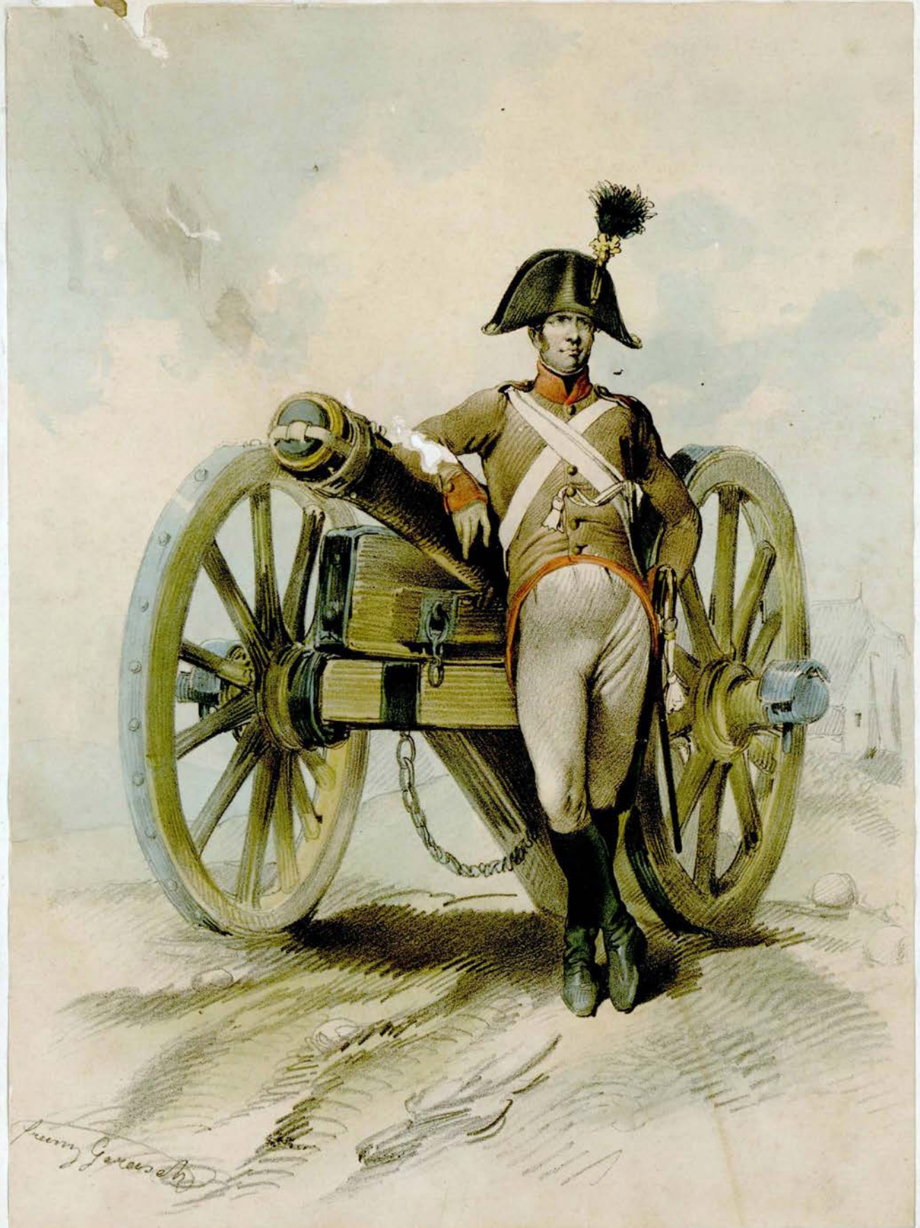
Das oesterr. Heer von 1809-1835.