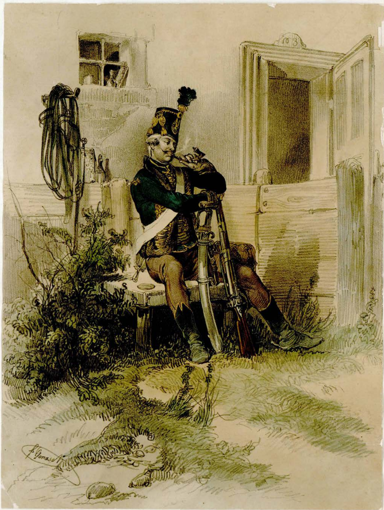
Das österr. Hussar von 1750 - 1790.