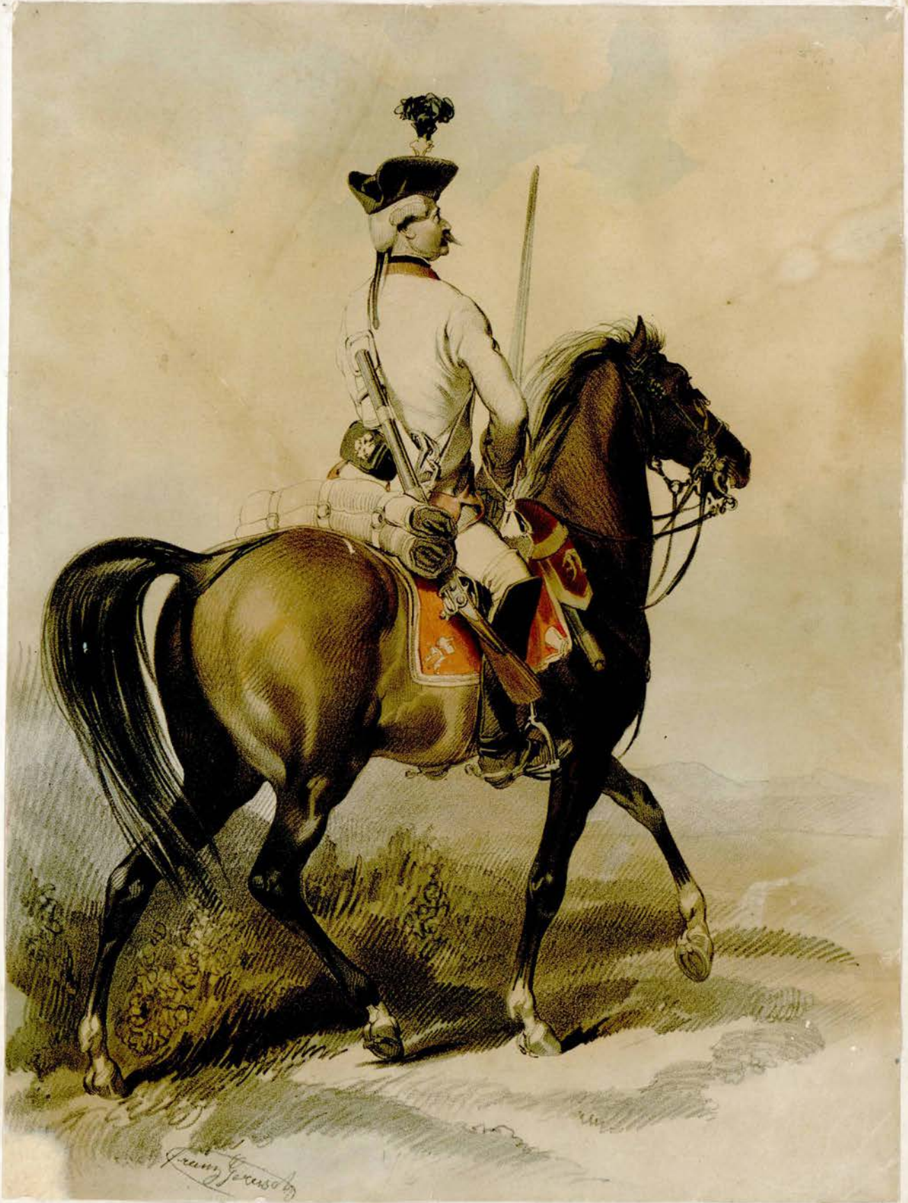
Das oesterr. Kür von 1750 - 1790.