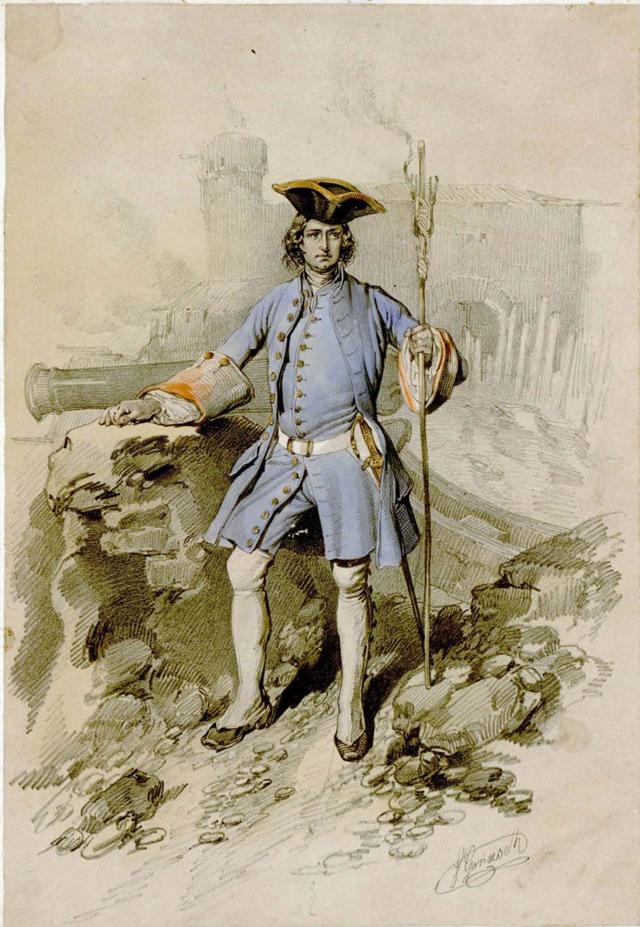
Das oesterr. Heer von 1683 - 1748.