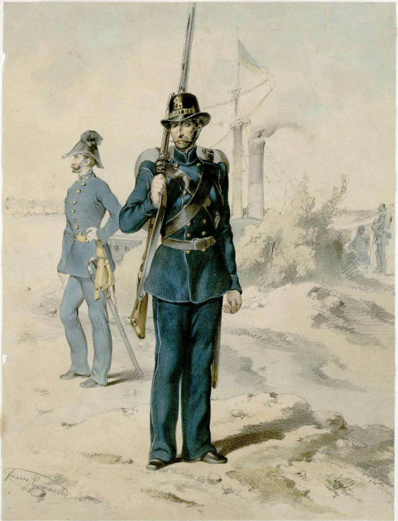
Das oesterr. Heer.