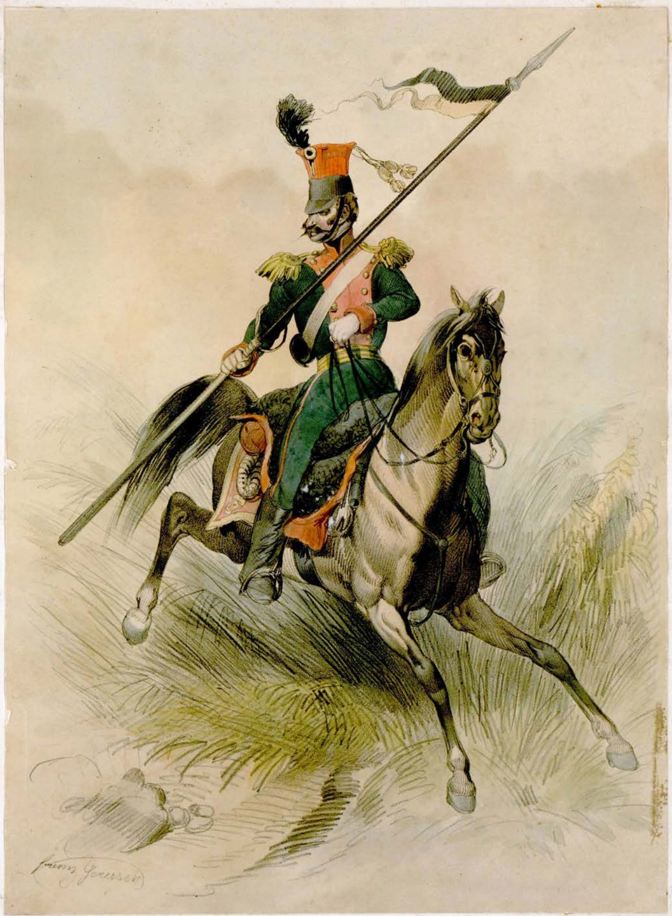
Das oester. Heer von 1809-1835.