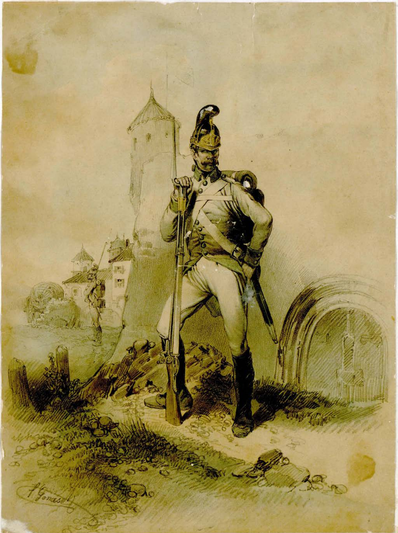
Das oesterr. Heer von 1790 - 1809.