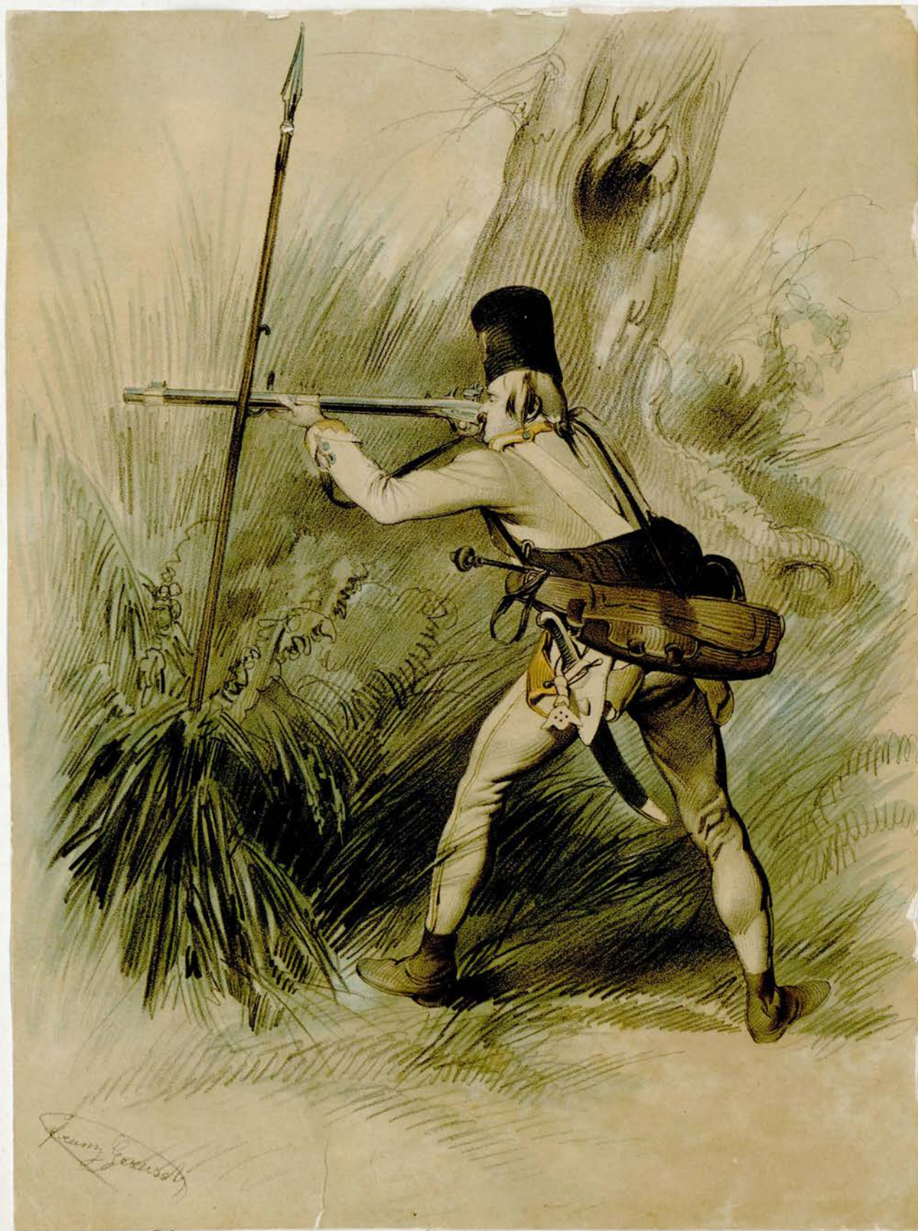
Das oesterr. Heer von 1750 - 1790.