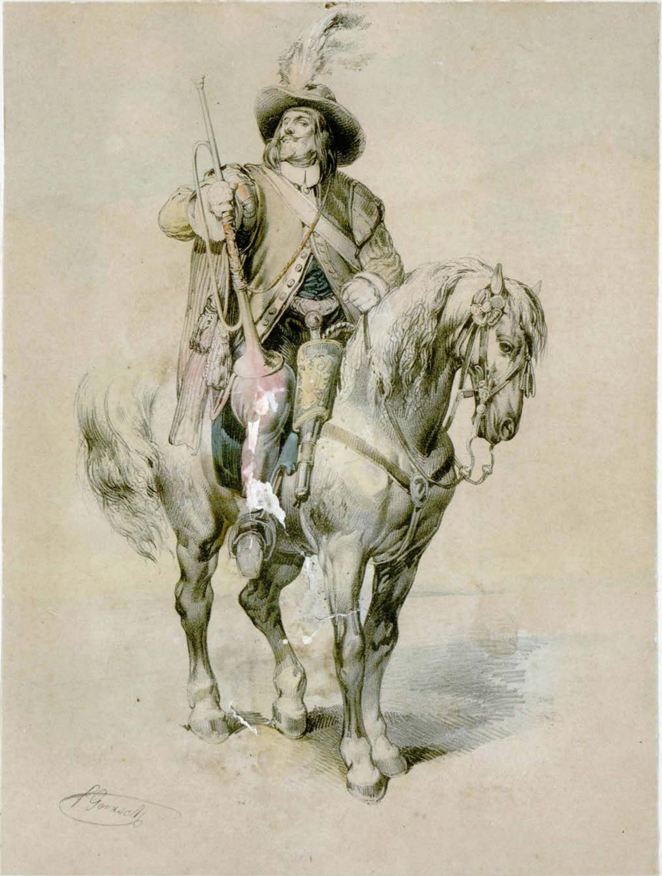
Das oesterr. Heer von 1620-1650.