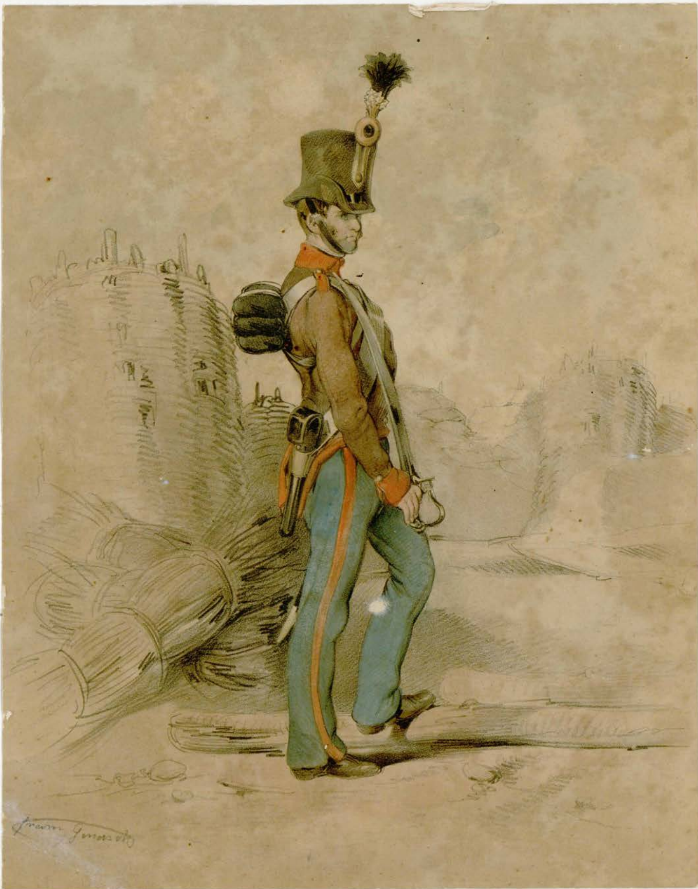
Das oesterr. Heer von 1835-1848.