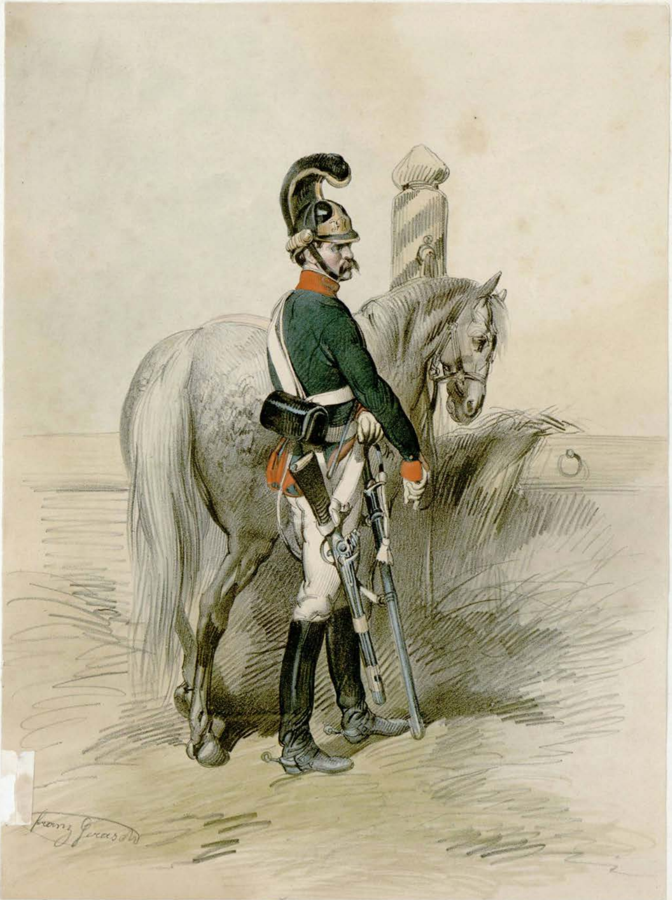
Das oesterr. Heer von 1809-1835.