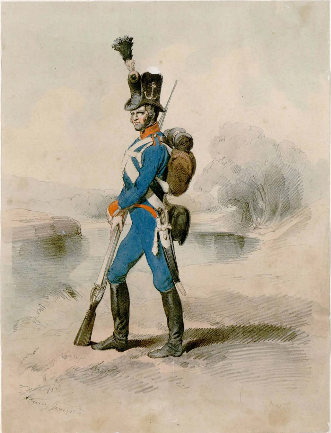
Das oesterr. Heer von 1809 - 1835.