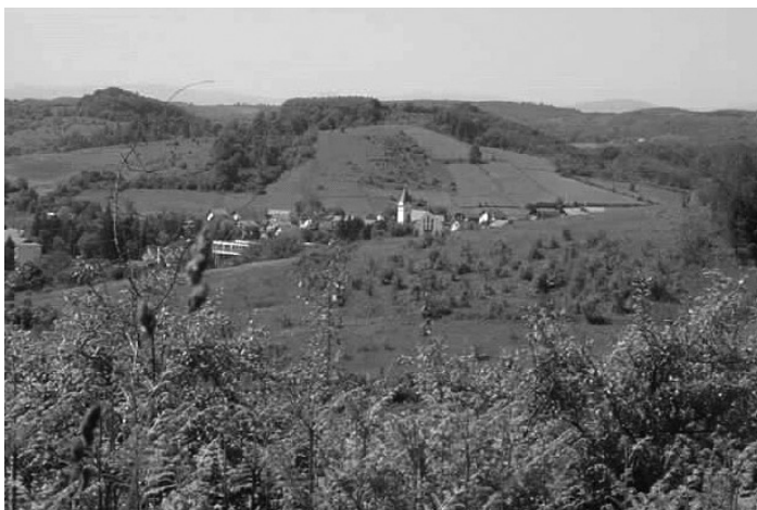
Појлед на Војнић с Црквишћа, у којем је јочейком 21. вијека, њрви њућ у историји, изираћена катхоличка црква

Шенкам погледе на Петрову гору, на којој се још увијек цакли напуштени и рањени самотњак. Споменик ужасу и невремену, када нас масовно побише. Сада га изгледом претварају у симбол темељитог прогонства и нестајања нашег народа.