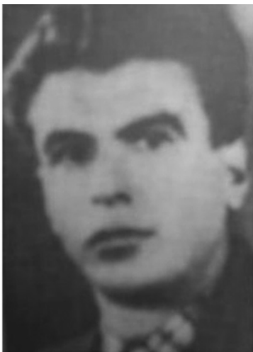
Доље: фотџографије Милића Најџала и Љубе Марјиновића