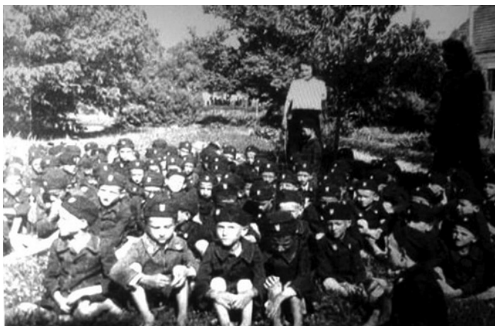
Српска дјеца с Козаре, Кордуна и Баније у лојорима НДХ, одијана у усташким униформама, њих сирахом, словом У и у духу мржње према својим коријенима

Тко да не чује глас трубље: на окуп за добро друга, човјека и брата.”