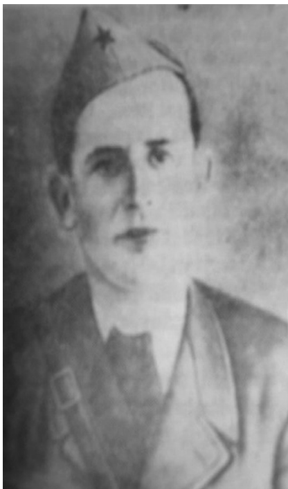
Душан Душко Бркић, државни тјужилац