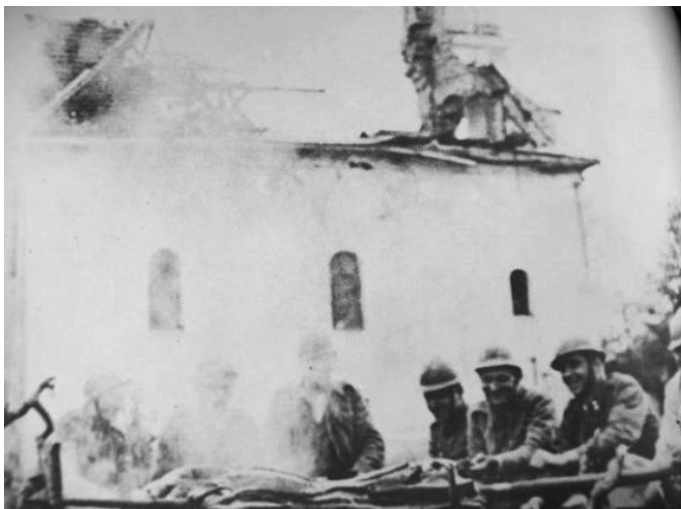
Хрвајски војници испред Православне цркве „Млада Неђеља“ у Војнићу, април 1942. Срушили су је 1947. године Срби скојејци из Војнића.

Стражар је искесио зубе, покварене и труле шкрботине. Дјеца застају. Гледају и у страху узмичу од наоружаног човјечуљка стравичног изгледа. На његовој нахереној капи свјетлуца слово У. Подсјећао је на авети из прича ђеда Николе Благојевића.