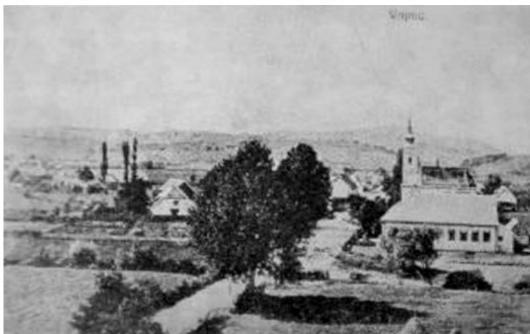
На слици је Основна школа и Православна црква „Млада Неђеља“ коју је хрватска војска 1942. године сaлaлa, а комунистички срушили 1947. године. Она је била и мучилишће Срба 1941/ 42.