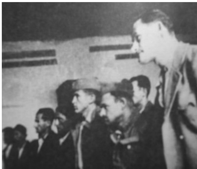
Ойшужени слушају йресуду