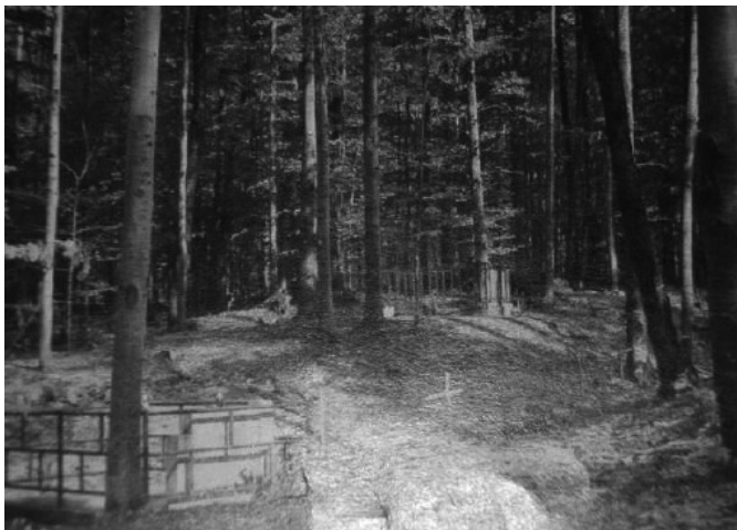
Барин коса у Пејировој џори, мјесто гдје је хрватска војска 1. априла 1942. године доијерала 234 српска цивила из збјегова Пејирове џоре, усмртила на звјерски начин 132 одрасла и 59 дјецe, а 43 њешико ранила