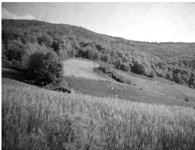
Пољед на обронке Пејирове горе који се у давнини назваше: Црна Локва

Сагнали су нас у Калове. Ту су нас прегледали, ко шта има. Што је за њих било, узели су, што није, побацали су. Онда су нас повезали жи-