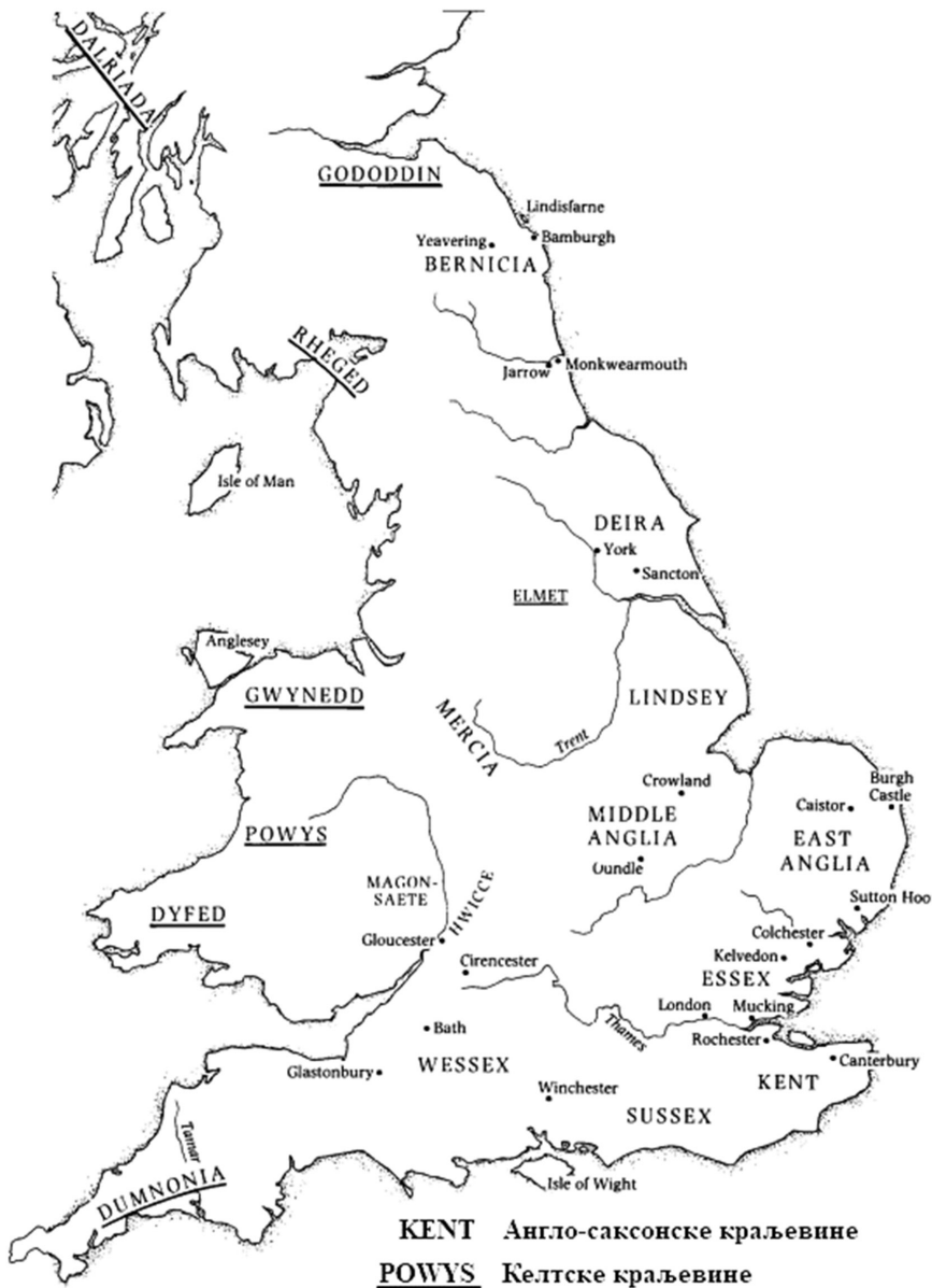
Карта 1. Британија у VII веку