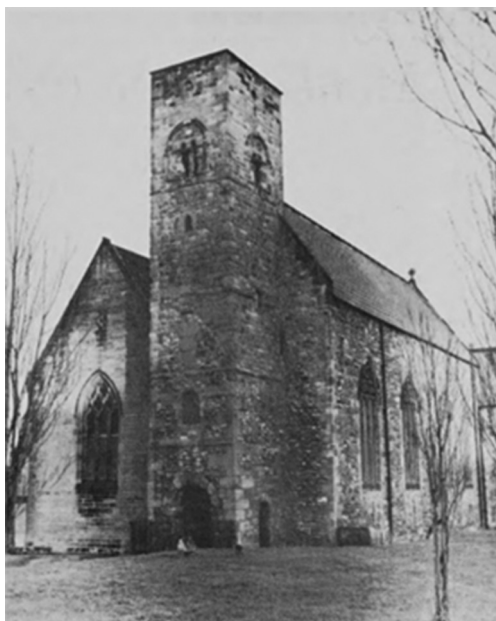
Слика 2. Западна страна Цркве Св. Петра из манастира Вермаут која је једина остала очувана из времена Бенедикта Бископа