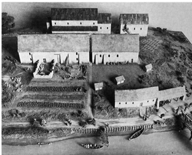
Слика 1. Модел манастира Џероу направљен на основу археолошких остатака из касног VIII века (Преузето: The Anglo-Saxons , 74)