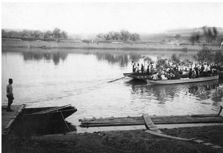
1905. 17/30. јули. Риболов на Ади.

17. јула. Добијем позив да дођем после подне на Аду, где ће прво бити риболов, а потом вечера. Отишао сам трамвајем