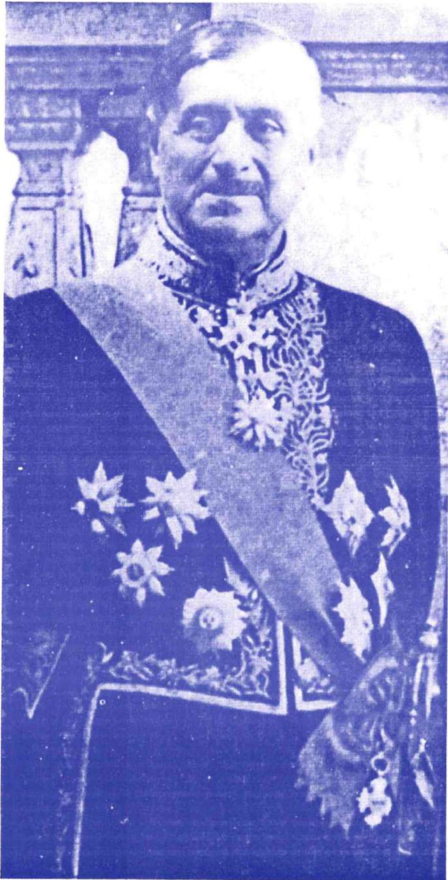
Јован Дучић – амбасадор Краљевине Југославије, 1939.