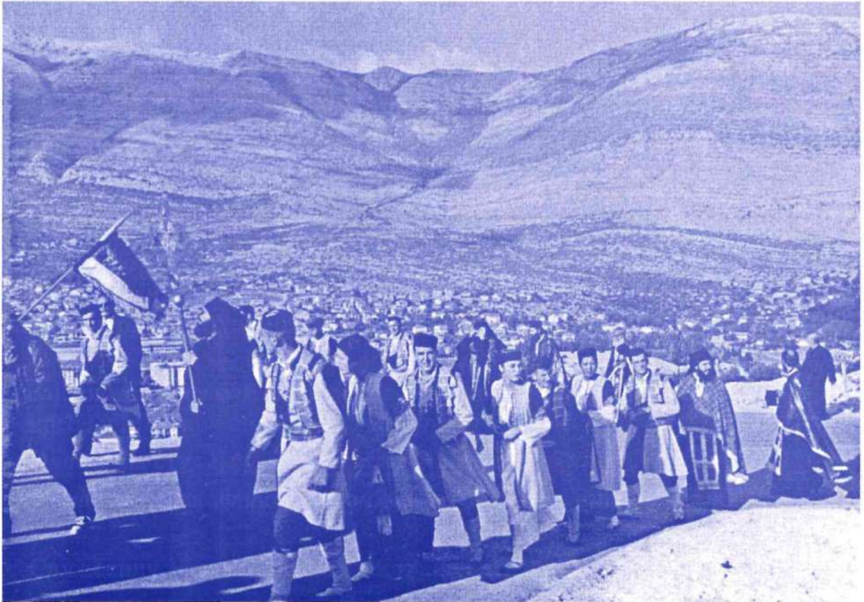
Свечана литија у Требињу

Велики бреж Леућар који се диже изнад мој родног Требиња, као мудро њлајно између неба и земље, носи илирско или жрчко име њо речи елефћерија, шћњо значи слобода. Са овог се брега види на ведром дану, њреко мора које је у близини, обала Ићалије. Тај велики видокруж није био без ућицаја на мој завичај и његове људе.