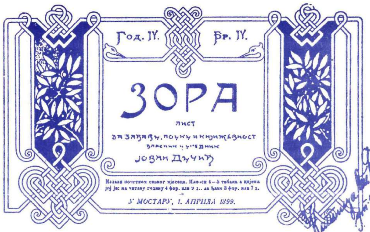
Насловна страна Зоре , уредник Јован Дучић

Репрезентанти не једног краја, него једног народа, њих тројица су начинили од малог Мостара град који је, захваљујући њима, заувек остао велик. Око 1900. Зора у Мостару, Босанска вила у Сарајеву, Срћ у Дубровнику, Бранково коло у Сремским Карловцима, Лейойис Мајице српске у Новом Саду и Српски књижевни гласник у Београду били су више но часописи, више но књижевни листови – били су, на разним тачкама земље у мраку, светлосни сигнали једног народа који није пристајао да буде уништен.