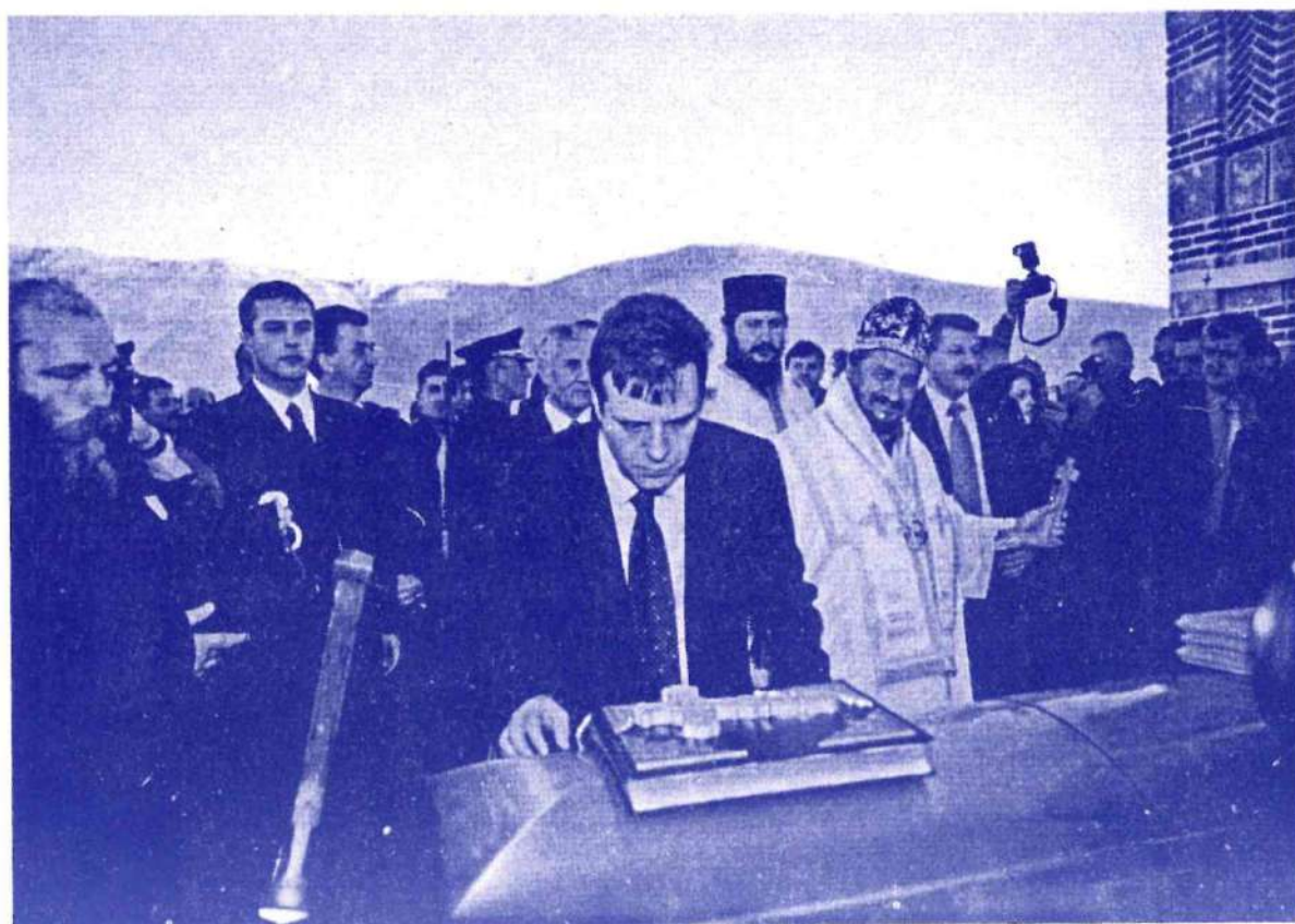
Др Војислав Кошћуница, председник СРЈ – са државницима Републике Српске одаје почасћ Јовану Дучићу