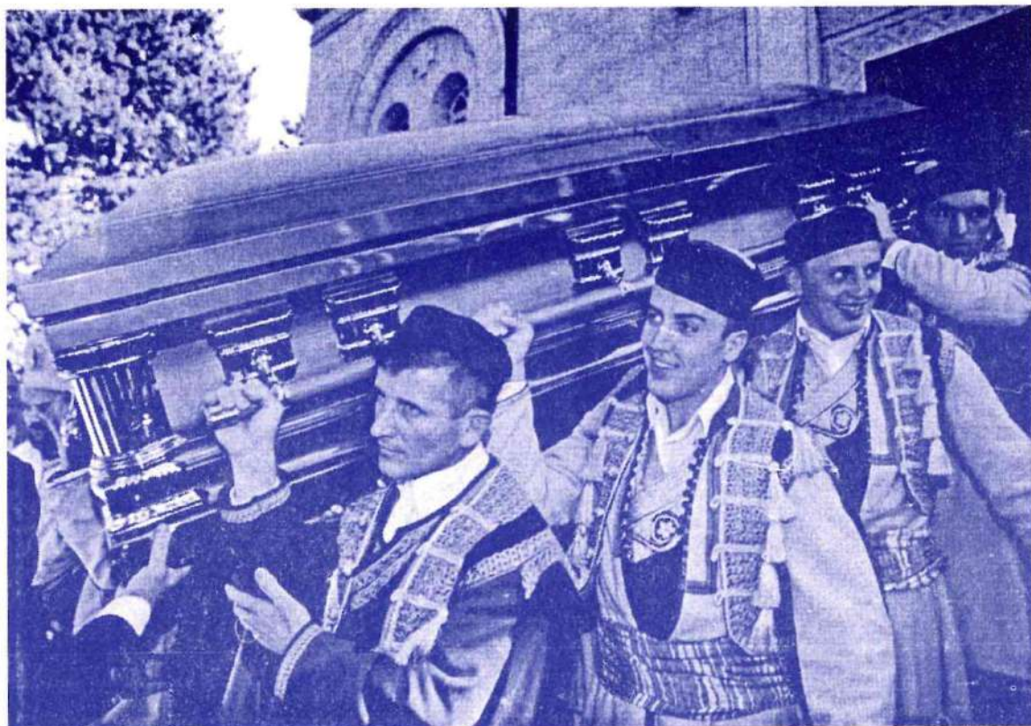
Јован Дучић у Никшићу