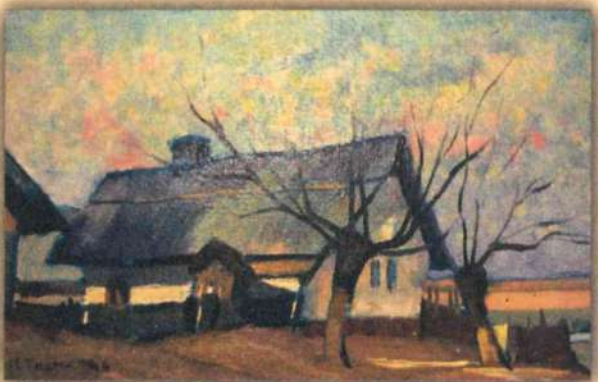
Мотив из Белог Брда