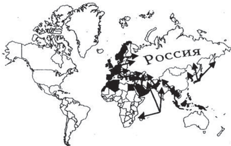
Карта 1. Мехенова Стратегија анаконде

кључних услова: „1) активна сарадња са британском поморском велесилом; 2) осујећивање немачких поморских претензија; 3) пажљиво праћење експанзије Јапана у Тихом океану и одупирање тој експанзији; 4) заједничке акције Европљана против народа Азије” (Дугин 2004: 57–58), на чијем испуњењу је Америка марљиво радила током XX века.