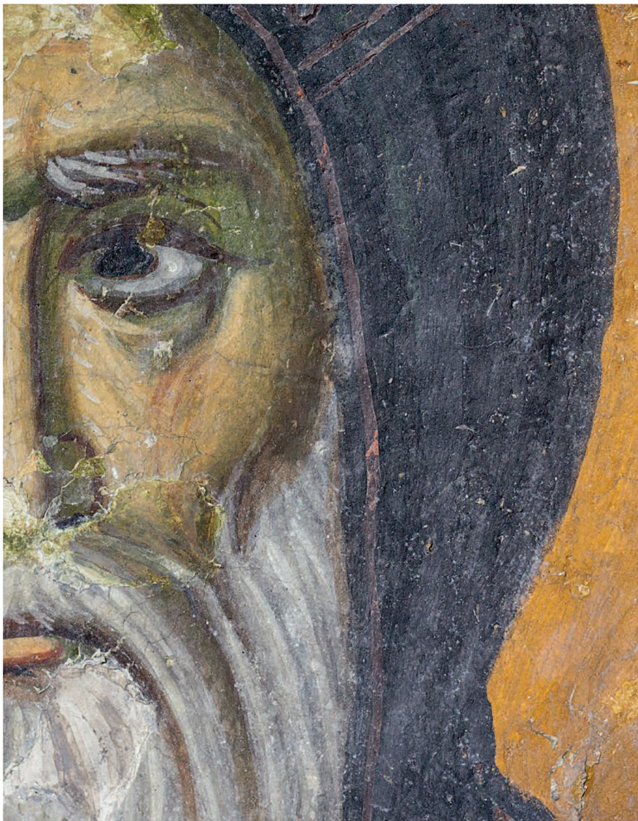
СТЕФАН НЕМАЊА – ПРЕПОДОБНИ СИМЕОН МИРОТОЧИВИ