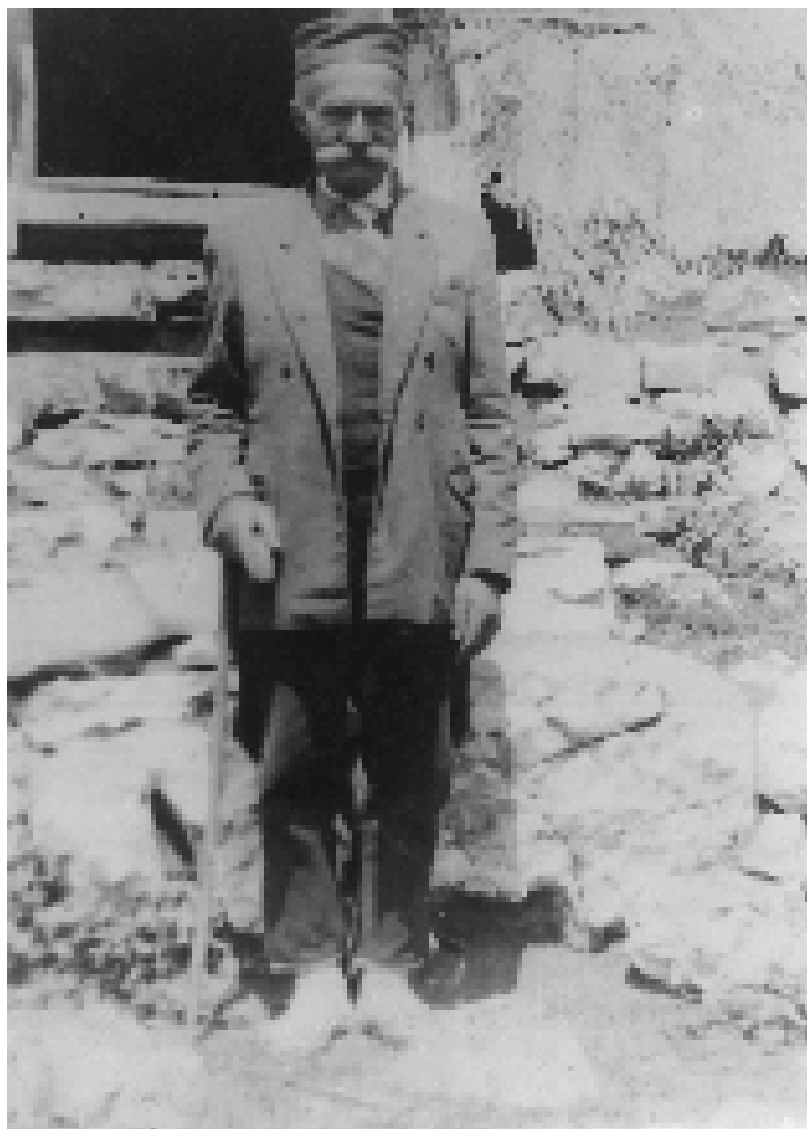
Дјед Танасије: „Мо’ш ме најануџи, али не мо’ш њрејануџи.“