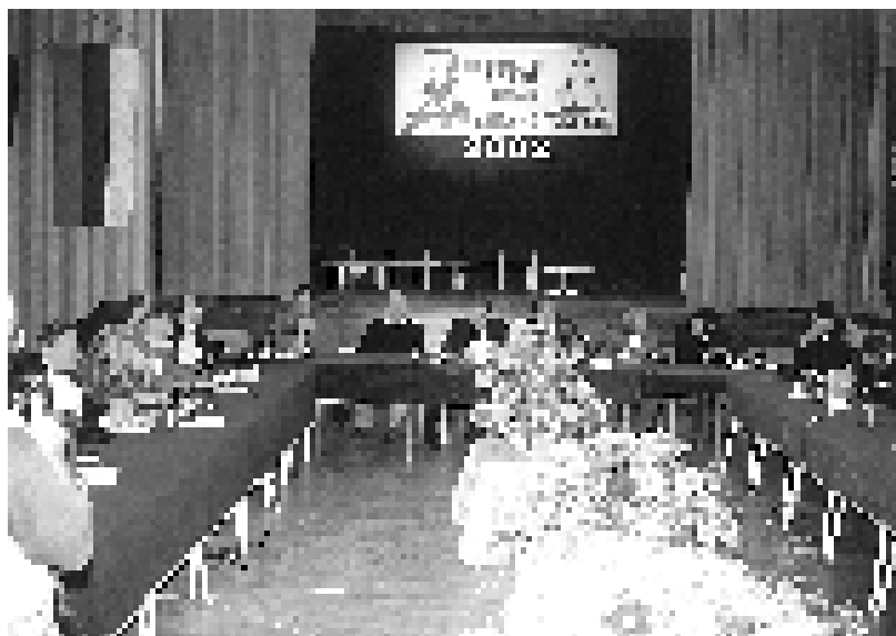
Окруїли сїо криїишке, Билећа, 2002.