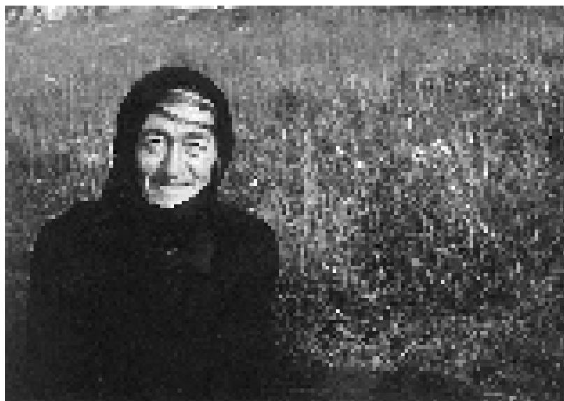
Тетка Савића (1925–2003)