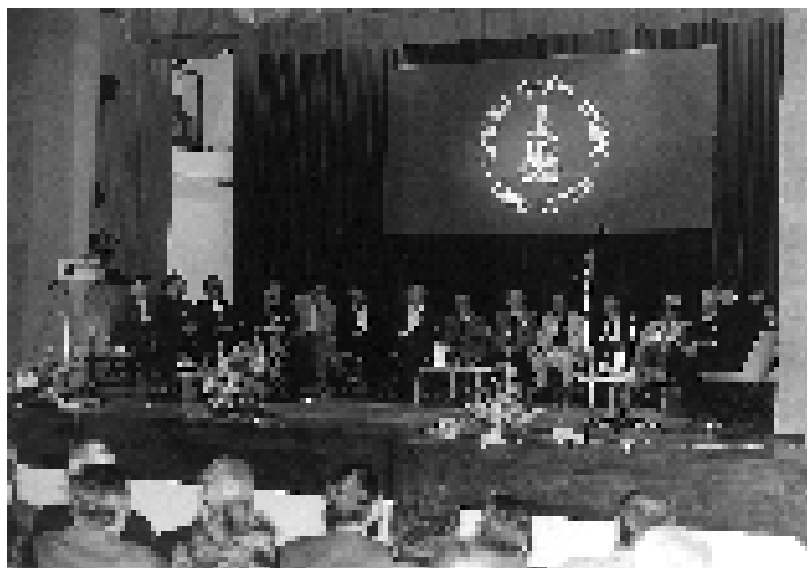
Књижевно вече „Српска проза данас“, Билећа, 1998.