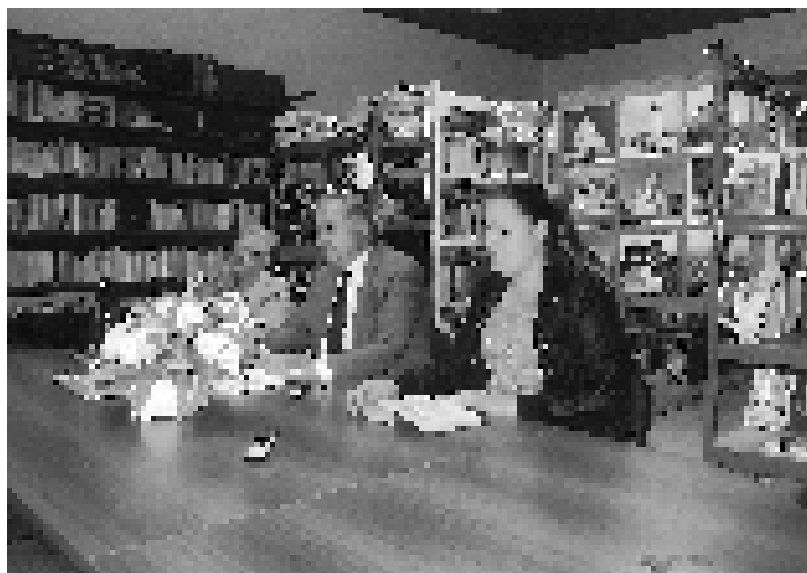
У Боровом Селу