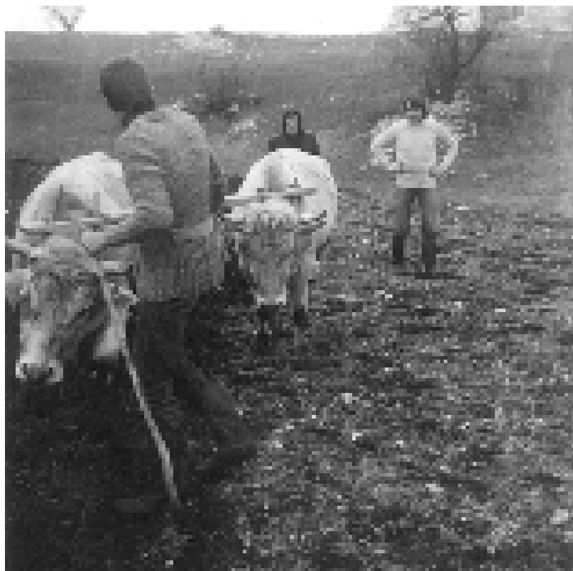
На орању, као јосмајрач