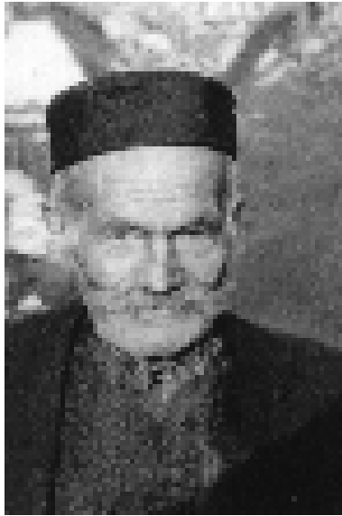
Дјед Танасије (1879–1970)