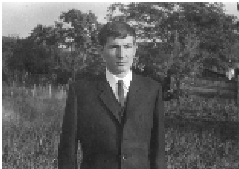
Из бруцошких дана