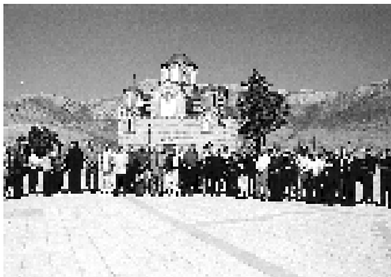
Пред Херцеїовачком Грачаницом