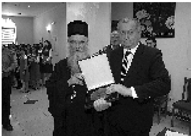
Уручење „Извишкре Њејошеве“ митрополију Амфилохију у Никшићу