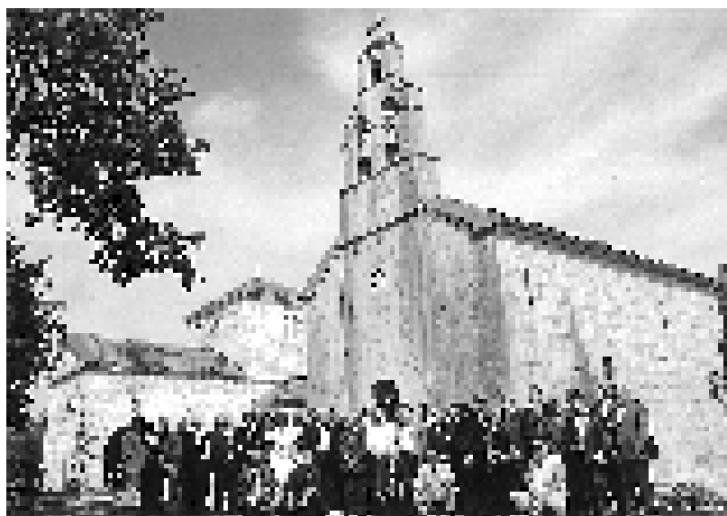
Пред црквом у Билећи