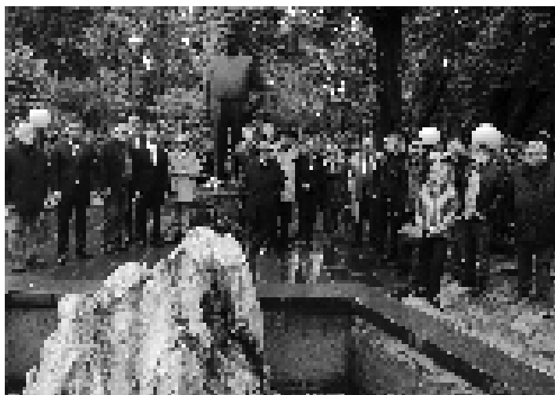
Пред Дучићевим сјомеником у Требињу