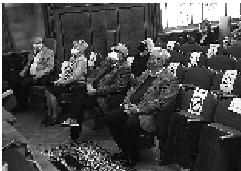
Под маскама у САНУ