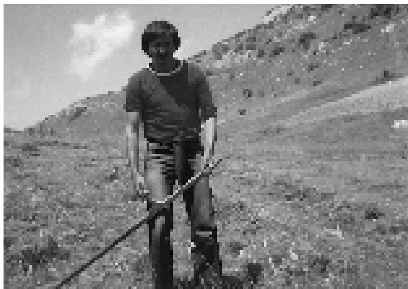
Коса, омиљена алајка