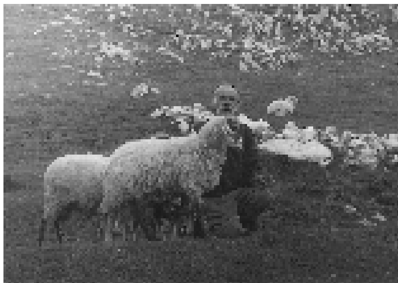
Ошац с омиљеним јаїњешом „Мрдаком“