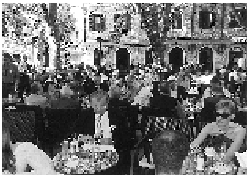
Под ђлајанима у Требињу