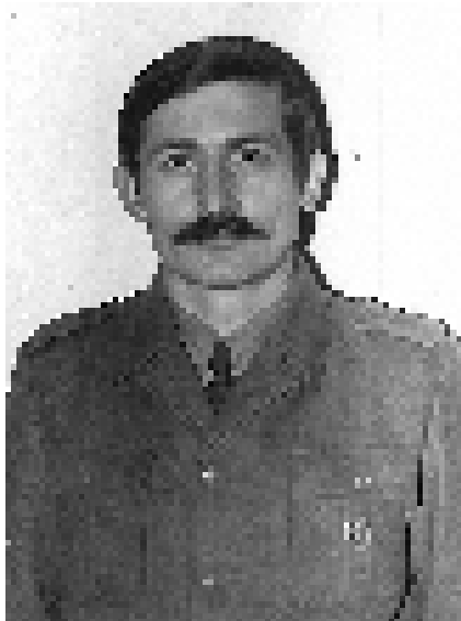
Највиши чин – млађи водник