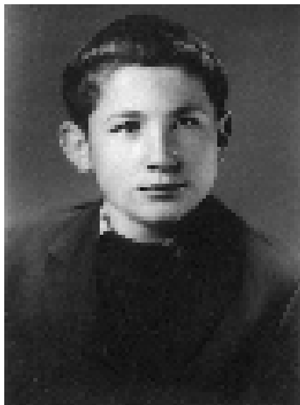
Први разред ђимназије