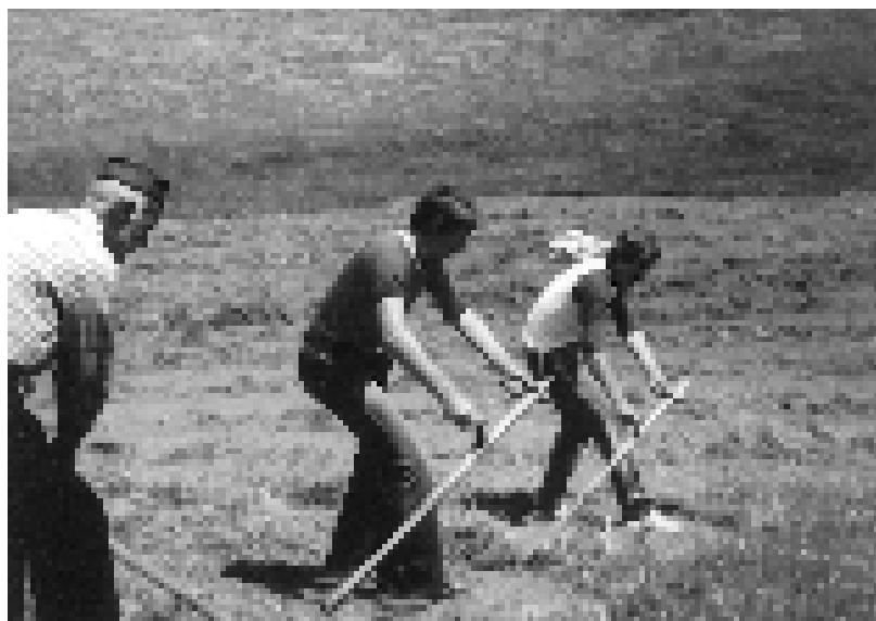
У заносу косидбе, између оца и браће