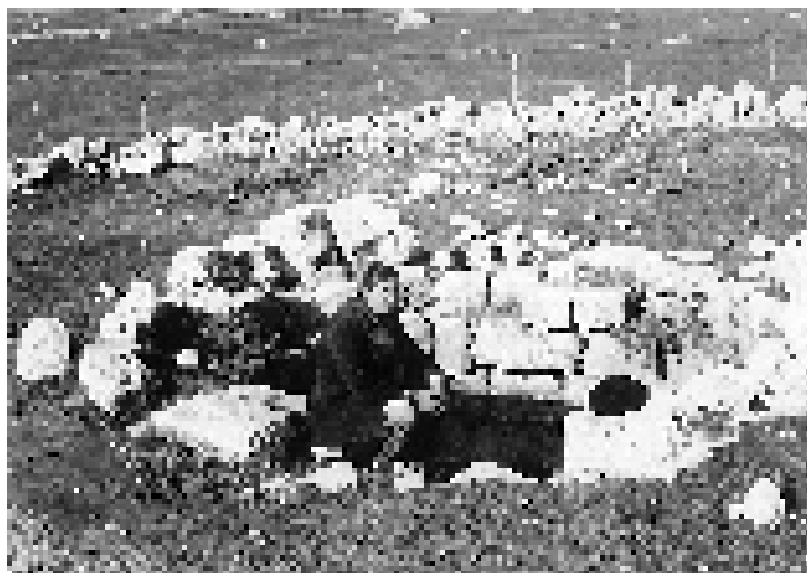
На ублу у Николину Долу, једином водојоју кайуна