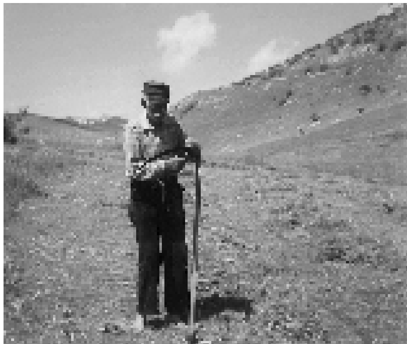
Отац Милисав (1910–1985)